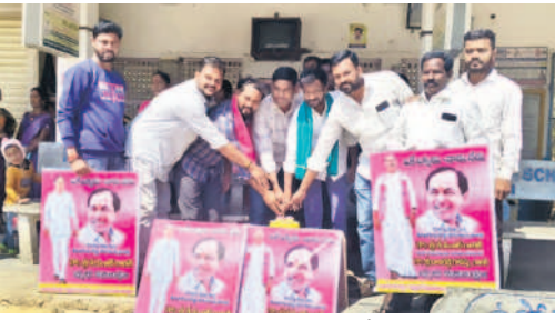
రుదూర్ బస్టాండ్లో కేక్ కట్ చేస్తున్న బీఆర్ఎస్ నాయకులు