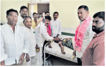
– కంఠేశ్వర్, ఫిబ్రవరి 17