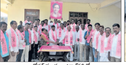
బోధన్ మండలం ఎరాజ్ పల్లిలో.