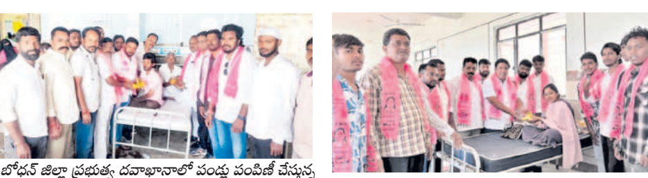
ఆర్మూర్ దవాఖానలో రోగులకు పండ్ల పంపిణీ..