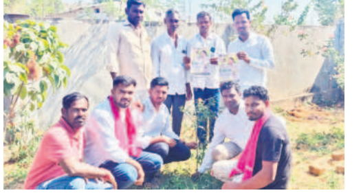
ో టగిరి అనాథ అశమంలో మొక్కలు నాటుతున్న బీఆర్ఎస్ నాయకుల