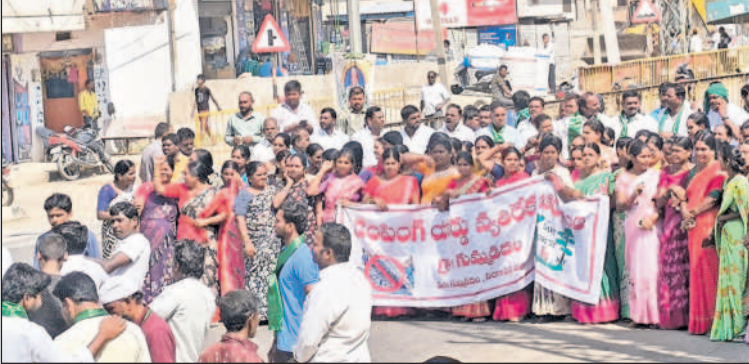
డంపింగ్ యార్డు అనుమతులు రద్దు చేయాలంటూ గుమ్మడిదలలో మహిళల భారీ ర్యాలీ