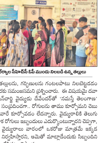
చేర్యాల సీహెచ్ఎస్ ఓపీ ముందు నిలబడి ఉన్న తల్లులు