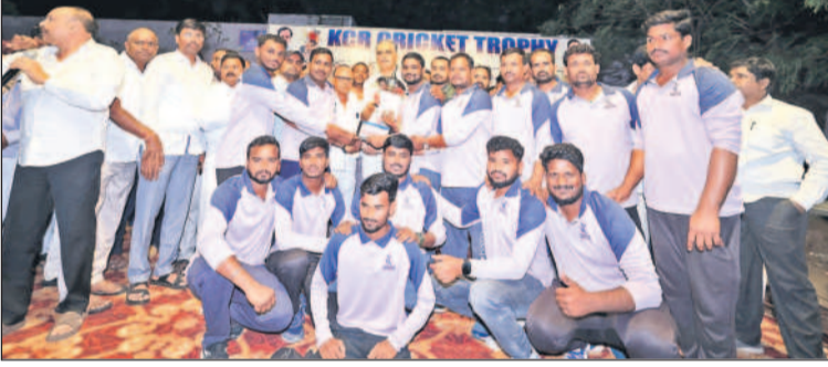
విజేతలకు బహుమతులు అందజేస్తున్న ఎమ్మెల్యే హరీశ్ రావు

రేవంత్ చెప్పకోవడం హాస్యాస్పదంగా ఉంద న్నారు. రేవంత్ వి మ్యూచ్ లు అన్ని తొండివి అని ఎద్దేవా చేశారు. మహిళలకు రూ.2500, తులం బంగారం, పెన్షన్లు, 6 గ్యారెంటీలు ఒక్క హామీ నిల బెట్టుకోలేదన్నారు. అభివృద్ధి ఆగిందని, రియల్ ఎస్టేట్ కంట్రాక్టులందని, ఆరోగ్యశాలలు జీవితాలు ఆగమైనట్లు హరీశ్ రావు ఆవేదన వ్యక్తం చేశారు. ఇప్పుడవి 6 వేల ఉద్యోగాలు... చెప్పినవి 2 లక్షల ఉద్యోగాలు అని విమర్శించారు. కేసీఆర్ తెలంగాణ గ్రాఫ్ పెంచితే రేవంత్ ఆ గ్రాఫ్ ను పడిపోయేలా చేశాడన్నారు. 6 నెలల నుంచి రేవంత్ రెడ్డి సిక్రెట్ రియల్ కండ్ల వెళ్లకండా పోటీలను చుట్టూ పెట్టు కొని పోటీలు కమాండ్ కంట్రోల్ రూమ్ లో ఉంటూ పాలన కొనసాగిస్తున్నారని విమర్శించారు. తెలంగాణలోని భద్రాచలం ప్రాంతానికి త్రిపు మహిళల క్రెకెట్ వర్కట్ కమిటీ సత్కారానికి దని, సిద్దిపేట శ్రీదాకారులు సైతం జాతీయస్థాయిలో రాణించాలన్నదే తన తపన అని హరీశ్ రావు అన్నారు. శ్రీదాకారులకు తనవంతు సహాయ సహకారాలు అందిస్తానని హామీ ఇచ్చారు. కాంగ్రెస్ సర్కారు వచ్చినప్పటి నుంచి సిద్దిపేటలో ఒక్క అభివృద్ధి కార్యక్రమం జరగలేదన్నారు. ఈ ప్రాంతంలో మంజూరైన వెటర్నరీ కళాశాలను సైతం రేవంత్ రెడ్డి తన నియోజకవర్గమైన కొండగల్ తు తరలించుకుపోయాడని విమర్శించారు. కేసీఆర్ అంటే ఒక శక్తి అని హరీశ్ రావు పేర్కొన్నారు. ఆనంతరం విజేతలకు బహుమతులు పంపిణీ చేసే సందర్భంగా కేసీఆర్ బిడ్డే కేసు కట్ చేసి నంటున్నారని విమర్శించారు. సిద్దిపేట మున్సిపల్ మాజీ చైర్మన్ రాజనరంజన్, సుదా మాజీ చైర్మన్ ర వీందర్ రెడ్డి, నాయకులు ఎడ్ల సోమిరెడ్డి, రజనీ కాంత్ రెడ్డి, చంద్రశాఖ, భూమయ్యగారి కిషన్ రెడ్డి, ఎద్దు యాదగిరి, శ్రీదాకారులు పాల్గొన్నారు.