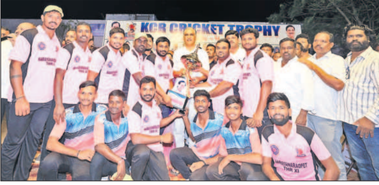
విజేతలకు బహుమతులు అందజేస్తున్న ఎమ్మెల్యే హరీశ్ రావు