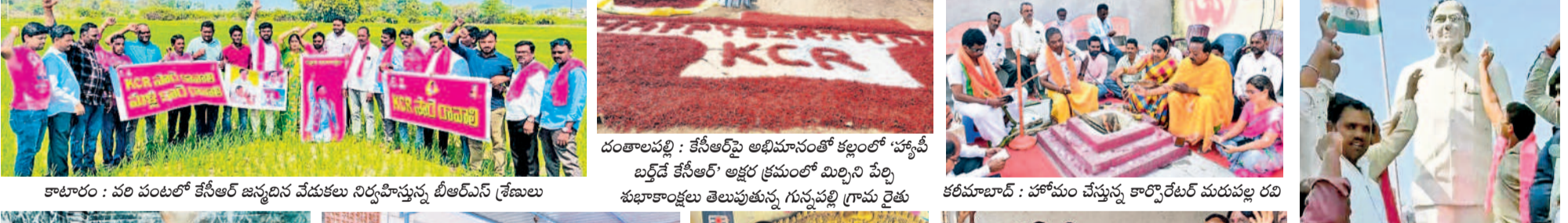
కాటూరు : వర పంటలో కేసీఆర్ జన్మదిన వేడుకలు నిర్వహిస్తున్న బీఆర్ఎస్ శ్రేణులు దంతాలపల్లి : కేసీఆర్ పై అభిమానంతో కల్లంలో 'హ్యాపీ బర్ట్ డే కేసీఆర్' అక్షర క్రమంలో మిర్చిని పెట్టి శుభాకాంక్షలు తెలుపుతున్న గున్నపల్లి గ్రామ రైతు కరీమాబాద్ : హోమం చేస్తున్న కార్పొరేటర్ మరుపల్ల రవి