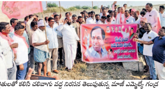
రైతులతో కలిసి చలివాగు వద్ద నిరసన తెలుపుతున్న మాజీ ఎమ్మెల్యే గండ్ర