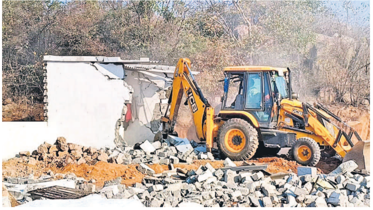
జవహర్ నగర్ లో మంగళవారం నిర్వాహకాధికారి సాగిన కుప్పవేతలు. తన ఇంటిని కూల్చివేయడానికి మహిళను ఎత్తుకెళ్తున్న పోలీసులు