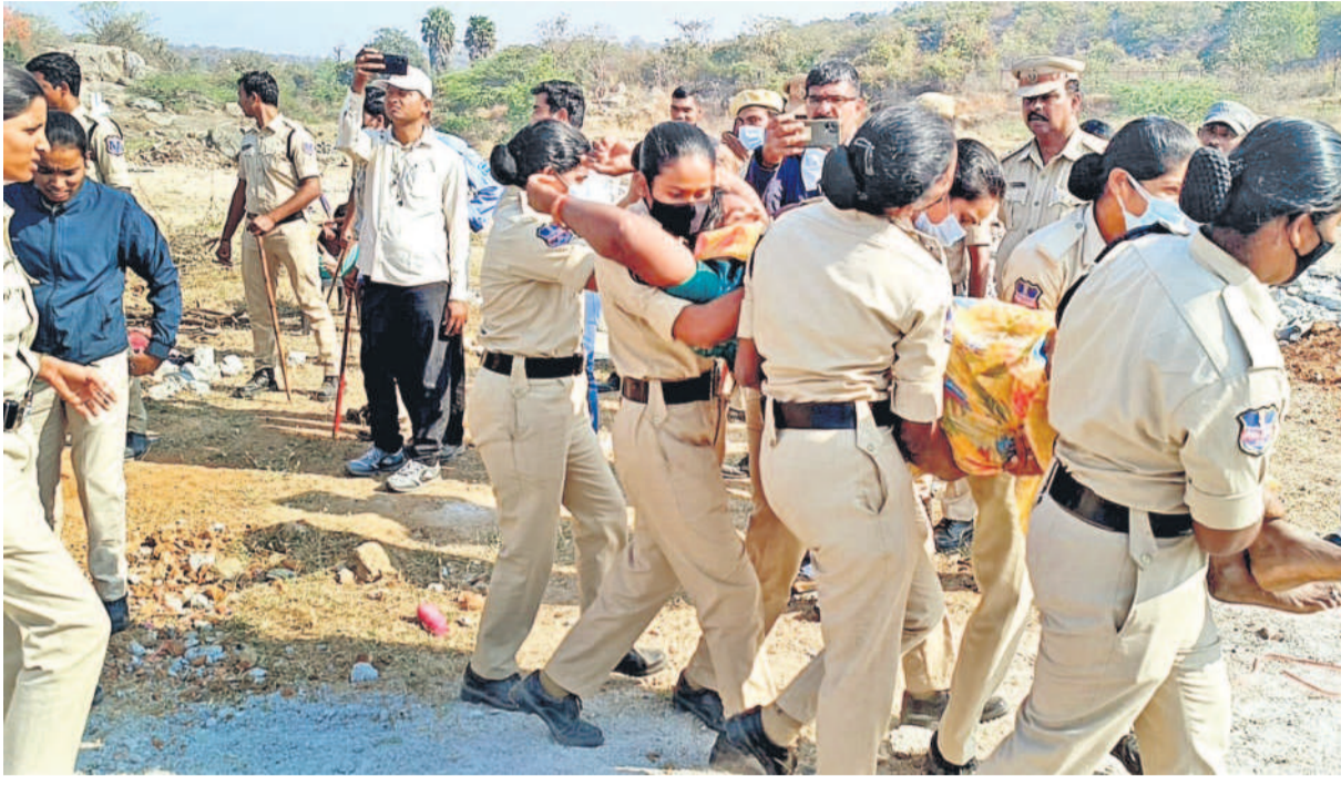
జవహర్ నగర్ లో మంగళవారం నిర్వాహకాధికారి సాగిన కుప్పవేతలు. తన ఇంటిని కూల్చివేయడానికి మహిళను ఎత్తుకెళ్తున్న పోలీసులు