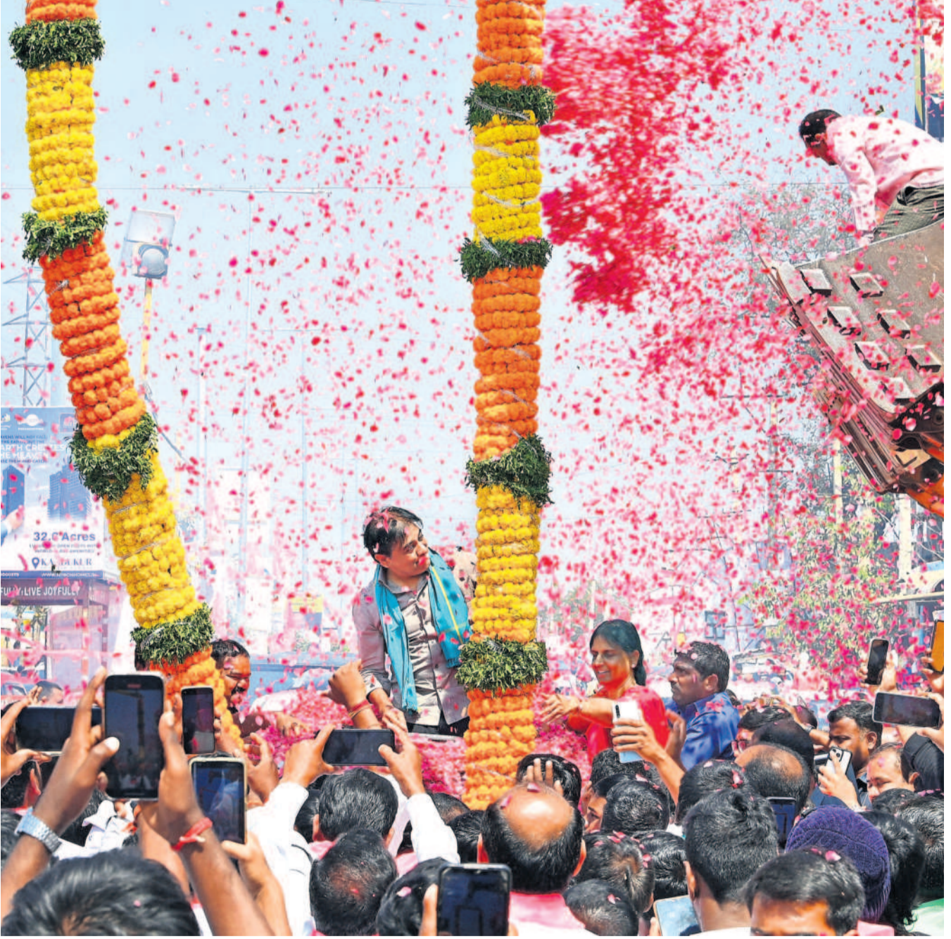
తుక్కుగూడలో మంగళవారం జరిగిన వర్కౌట్ సైనిక కేటీఆర్, మాజీ మంత్రి సజ్జా ఇంద్రారెడ్డిలకు గజమాలతో ఘన స్వాగతం పలికిన గులాబీ శ్రేణులు

15 నెలల నుంచి కాలయాపన కాంగ్రెస్ ప్రభుత్వం అధికారంలోకి వచ్చి 15 నెలలు కావొస్తున్నా ఒక్క పథకంపైనా స్పష్టత లేకపోవడంతో ప్రజలు ఆయాపయానికి గురవుతున్నారు. ఏదాని నుంచి దరఖాస్తుల పేరిట కాలయాపన చేస్తూ.. ప్రజలను ఇబ్బందులకు గురి చేస్తున్నారని మండిపడుతున్నారు. ఇప్పటిదాకా దరఖాస్తులు చేసుకోవడమే కానీ ఒక్కరికి కూడా లబ్ధి చేకూరలేదని ఆవేదన వ్యక్తం చేస్తున్నారు. దరఖాస్తు, ఆధార్ కార్డుల జిరాఫీలతో వందలాది రూపాయలు ఖర్చవుతోందని అంటున్నారు. దరఖాస్తుల పేరిట రోజూ తరబడి ప్రభుత్వ కార్యాలయాల చుట్టూ తిరగడమే కానీ.. ప్రభుత్వ పథకాలు అమలైన దాఖలాలు లేవని నిట్టూరుస్తున్నారు.