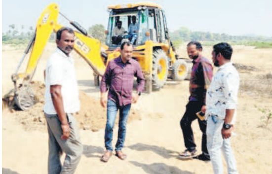
కస్పెకట్కూర్ మానేర్ వాగులోకి ట్రాక్టర్లు, ఇతర వాహనాలు వెళ్లకుండా

రవాణా పై రెవెన్యూ అధికారులు కొరడా ఝులిపించారు. కస్బెకట్కూర్లోని మానేరు వాగు నుంచి రాత్రి వేళలో అక్రమ రవాణా జోరుగా సాగుతున్నదని, పెద్ద మొత్తంలో ఇసుకను డంపు చేస్తున్నారని సోమవారం రాత్రి స్థానికులు పోలీసు, రెవెన్యూ అధికారులకు సమాచారం అందించారు. సోషల్ మీడియా లోనూ ప్రచారం సాగింది. మంగళవారం ఉదయం రంగంలోకి దిగిన రెవెన్యూ అధికారులు విచారణ చేపట్నారు. ఇసుకను అక్రమంగా రవాణా చేయకుండా, వాహనాలు మానేరు వాగులోకి వెళ్లకుండా జేసీబీతో కందకాలు తవ్వించారు. శివారులో డంపు చేసిన ఇసుకను గుర్తించామని, సీజ్ చేసినట్లు తహసీల్గార్ జయంత్ కుమార్ తెలిపారు. అక్రమ రవాణా చేస్తే చర్యలు తీసుకుంటామని హెచ్చరించారు. ఆయన వెంట ఆర్ఐ దిలీప్, రెవెన్యూ సిబ్బంది ఉన్నారు.