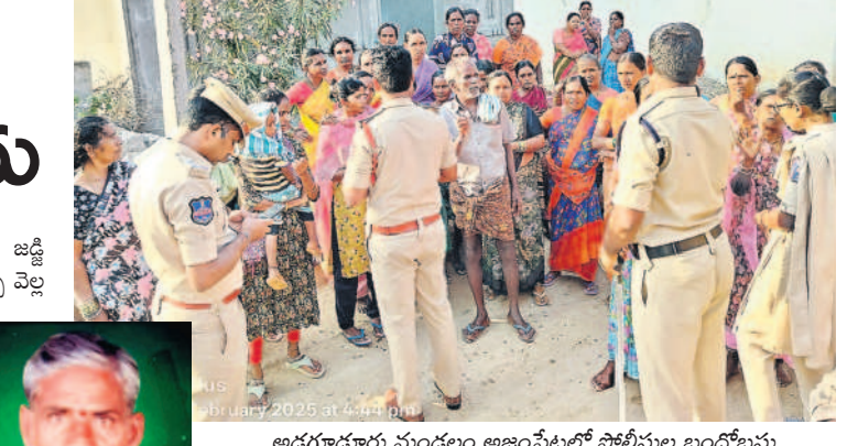
అడ్డగూడూరు మండలం అజంపేటలో పోలీసుల బందోబస్తు

సూర్యాపేట టౌన్/వివేకం, ఫిబ్రవరి 18 : దురాజేపల్లి పెద్దగట్టు జాతరకూ మూడో రోజూ జనం పోటిస్తారు. లింగయ్యుల స్వామిని దర్శనానికి మంగళవారం తెల్లవారుజాము నుంచి రాత్రి వరకు దాదాపు 5లక్షల మందికిపైగా వచ్చినట్లు అంచనా. యాదవ పెద్దలు గుడి ముందు చంద్ర పట్నం వేసి గంగమ్మ, కాళరాజు, ఎర్రయ్య, యలమంచమ్మ, సానమ్మ తదితర 12 దేవతామూర్తుల విగ్రహాలను పెళ్లి ప్రత్యేక పూజలు చేశారు. మధ్యాహ్నం బలి ఇచ్చి విగ్రహాలను తీసేశారు. ఎమ్మెల్యే కల్వకుంట్ల కవిత, మాజీ మంత్రి తలసాని శ్రీనివాసయ్యాదవ్, మాజీ ఎమ్మెల్యేలు గాదరి