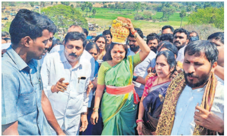
పెద్దగట్టు జాతరలో బోసం ఎత్తుకొని వస్తున్న ఎమ్మెల్యే కవిత, పక్కన మాజీ ఎంపీ బుద్ధగుల లింగయ్య, బాలరాజు యాదవ్, మాజీ జడ్పీ చైర్మన్ గుణ్ణ దీపిక