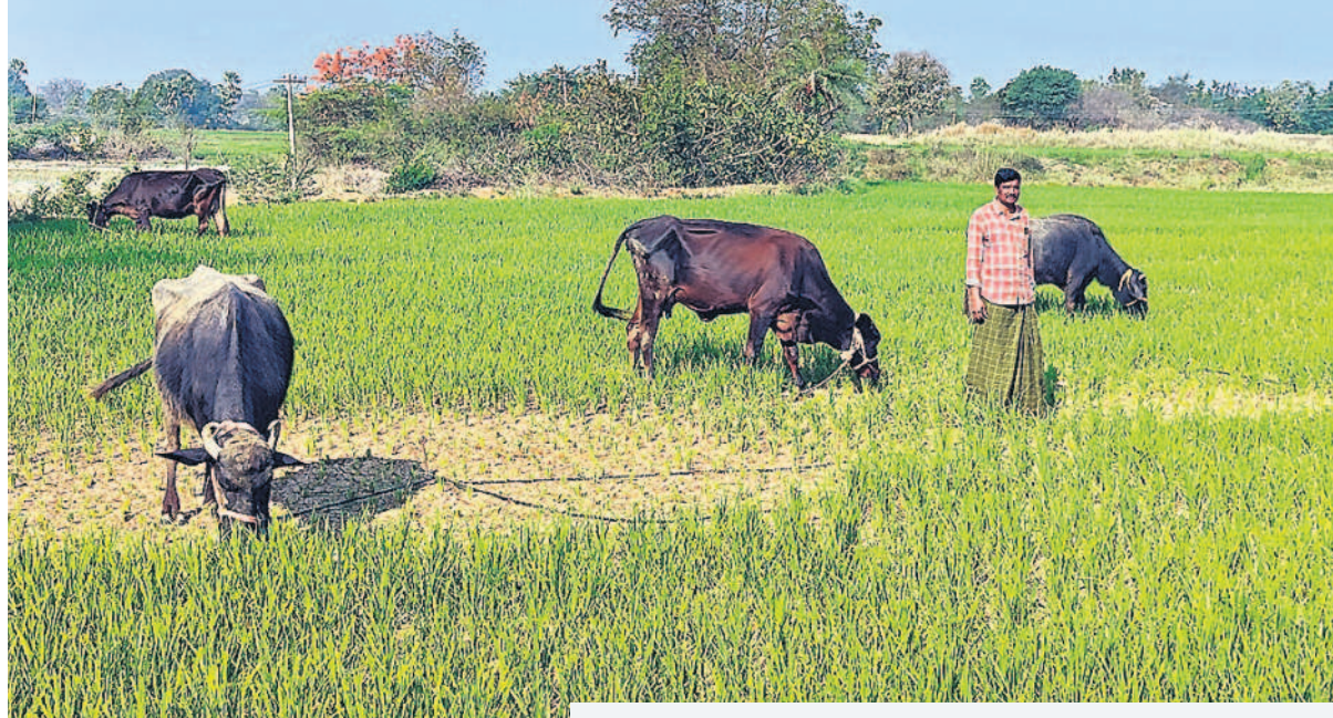
రాజాపేట : నీళ్లు లేక కుర్రాల్లో ఎండిన పోయిన వరి చేనులో పశువులను మేపుతున్న రైతు కొండలేర్పిడి

జిల్లాలో భూగర్భ జలాలు రోజురోజుకూ పడి పోతున్నాయి. బోర్లు, బావులు నీటి జాడ లేక వట్టిపోతున్నాయి. జనవరి నెలలో సగటున 10 మీటర్ల కిందికి వెళ్ళాయి. ఇప్పడే ఇలా ఉంటే ఎండకాలం పరిస్థితి ఏంటనే ఆందోళన వ్యక్తమవుతున్నది. జిల్లాలో గతంలో పుష్కలంగా ఉన్న పాతాళ గంగ ఇప్పుడు అడుగంటుతున్నది. ఇంతకు ముందు బిడు మీటర్ల లోతులోనే నీళ్లు ఉండగా, ప్రస్తుతం రెట్టింపు స్థాయిలో కిందికి వెళ్ళాయి. జిల్లాలో 2024 జనవరిలో 7.29 మీటర్ల లోతులో భూగర్భ జలాలు ఉండగా, ఈ జనవరిలో 10 మీటర్లకు చేరాయి. 2.71 మీటర్ల మేర పడిపోయాయి. డిసెంబర్ లో 9.03మీటర్ల దూరంలో ఉండగా.. నెల వ్యవధిలోనే మీటర్లు కిందికి వెళ్ళాయి.