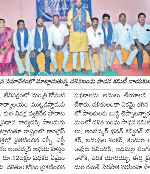
జరిగిన సమావేశంలో మాట్లాడుతున్న దళితబంధు సాధన కమిటీ నాయకులు