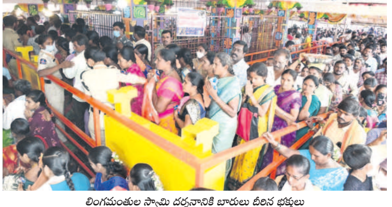
లింగయ్యుల స్వామి దర్శనానికి బాబులు దీన భక్తులు

కేసీఆర్ తోనే సూర్యాపేట జిల్లా, మెడికల్ కాలేజీ రాష్ట్రం రావడం వల్లే సూర్యాపేట జిల్లా అయ్యిందన్నారు. దాదాపు 50 సంవత్సరాలు పాలించిన కాంగ్రెస్, టీడీపీ ఏనాడూ సూర్యాపేటకు మెడికల్ కళాశాల కావాలన్న ఆలోచన చేయలేదని తెలిపారు. గతంలో తాము ఇక్కడ కళాశాల పెడతాముంటే పెట్టనియకుండా చేశారని ఎన్ఆర్ఎలకు కొందరు చెప్పింటాడని పేర్కొన్నారు. కేసీఆర్ ప్రభుత్వంలో సూర్యాపేటకు ప్రభుత్వ మెడికల్ కాలేజీ వచ్చిందని తెలిపారు. ఇక్కడి ఎస్సీ అఫీసు చూస్తే ఉత్తర భారతదేశంలోని చిన్న చిన్న రాష్ట్రాల్లో సెక్టరీయట్లు కూడా ఇలా ఉండవచ్చన్నారు. పేదరిక బిడ్డలకు నాణ్యమైన విద్యను అందించేందుకు కేసీఆర్ 1,200 పనుల గృహాలు, వెయ్యికిపైగా జూనియర్ కళాశాలలు, 27 మహిళా డిగ్రీ కళాశాలలు అందుబాటులోకి తెచ్చారని గుర్తుచేశారు. కాశీ శ్రీరం ప్రాజెక్టు ద్వారా గోదావరి నీళ్లు తెచ్చి సూర్యాపేట జిల్లాలోని సంస్థానాలను చేసిన ఘనత కేసీఆర్ రేచిననే తెలిపారు. నాడు సూర్యాపేట జిల్లాలో దాదాపు 2.95 లక్షల ఎకరాలకు కాశీశ్రీరం ద్వారా నీళ్లు అందిస్తూ.. నేడు కాంగ్రెస్ ప్రభుత్వం మేడిగడ్డను పండబెట్టి పంటలను ఎండబెడుతున్నదని ఆవేదన వ్యక్తం చేశారు. ఇదే జిల్లాకు చెందిన నీటి పారుదల శాఖ మంత్రి ఉత్తమకుమార్ రెడ్డి ఎందుకు నీళ్లు తెవడం లేదో సమాధానం చెప్పాలని నిలబేశారు. మేడిగడ్డ ఇంజనీర్ ప్రాజెక్టును మిసిరా దారు. తెలంగాణ ప్రత్యేక రాష్ట్ర బిల్లు లోకసభలో ఆమోదం పొందిన రోజునే పెద్దగట్టు జాతరకు రావడం సంతోషంగా ఉండవచ్చు. లింగయ్య ప్రశాంత్ వాతావరణంలో జాతర జరుపుకోవాలని, లింగయ్య ఆశీస్సులు అందరిపై ఉండాలని కోరారు. బీఆర్ఎస్ హయాంలో రూ.14 కోట్ల వెచ్చించి కనీవినీ ఎదుగు రీతిన పెద్దగట్టును అభివృద్ధి చేయడాన్ని గుర్తుచేశారు. తెలంగాణ