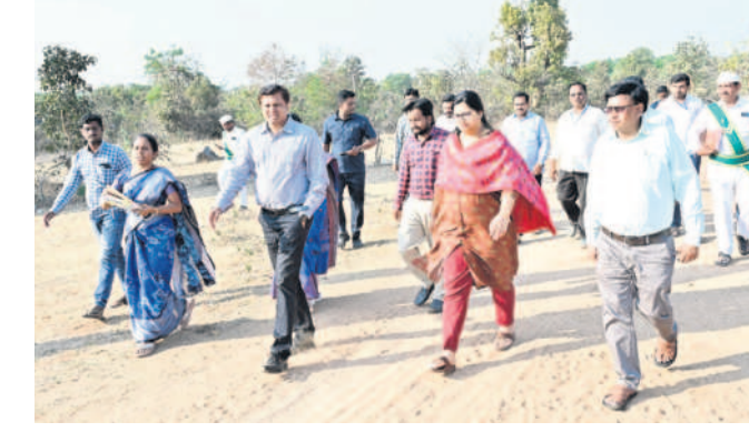
దివాలపూర్ : ఇంటిగ్రేటెడ్ రెసిడెన్షియల్ స్కూల్ ఏర్పాటు స్థల పరిశీలనకు వెళ్తున్న...