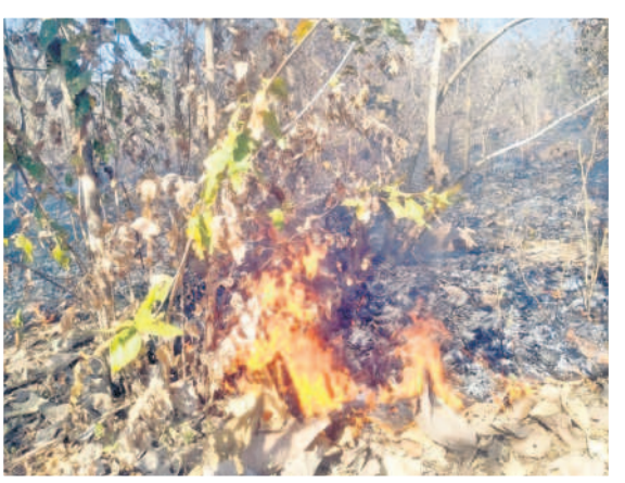
అటవీ ప్రాంతంలో చెలరేగుతున్న మంటలు

ఇంద్రవైది రేంజ్ పరిధిలోని అటవీ ప్రాంతంలో మంటలు వ్యాపించడంతో చెట్లు కాలిపోతున్నాయి. వేసవిలో కార్చిచ్చు ఏర్పడకుండా అటవీ శాఖ అధికారులు గ్రామీణులకు అవగాహన కల్పించాలి. కానీ.. కార్చిచ్చులు నిర్వహించకపోవడంతో చిలువైన చెట్లు కాలిపోతున్నాయి. అటవీ శాఖ అధికారుల నిర్లక్ష్యం కారణంగా ఇంద్రవైది అటవీ శాఖ పరిధిలోని దోడవడ, చిద్రోల భానాపూర్, అంజ, వడగాం, దోంగర్ గాం, పులిమడుగు, గట్టిపల్లి, దస్తాపూర్ అటవీ ప్రాంతాల్లో కార్చిచ్చు ఏర్పడి హానికరంగా అటవీ నాశనం మొక్కలతోపాటు పాదలు, మొక్కలు, చెట్లు కాలిపోతున్నాయి. అంతేకాకుండా జంతువులు, వృక్షాల రక్షణ లేకుండా పోతుండని మండల ప్రజలు వాపోతున్నారు. అధికారులు ముందస్తు చర్యలు తీసుకుని మంటలు వ్యాపించకుండా జాగ్రత్తలు తీసుకోవాలని జంతు ప్రేమికులు కోరుతున్నారు. - ఇంద్రవైది, ఫిబ్రవరి 19