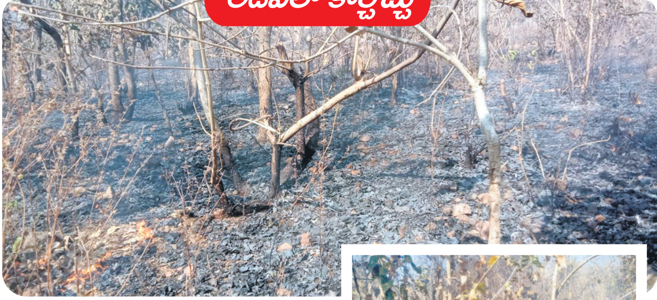
అడవిలో మంటలు వ్యాపించడంతో కాలిన చెట్లు

ఇంద్రవైది రేంజ్ పరిధిలోని అటవీ ప్రాంతంలో మంటలు వ్యాపించడంతో చెట్లు కాలిపోతున్నాయి. వేసవిలో కార్చిచ్చు ఏర్పడకుండా అటవీ శాఖ అధికారులు గ్రామీణులకు అవగాహన కల్పించాలి. కానీ.. కార్చిచ్చులు నిర్వహించకపోవడంతో చిలువైన చెట్లు కాలిపోతున్నాయి. అటవీ శాఖ అధికారుల నిర్లక్ష్యం కారణంగా ఇంద్రవైది అటవీ శాఖ పరిధిలోని దోడవడ, చిద్రోల భానాపూర్, అంజ, వడగాం, దోంగర్ గాం, పులిమడుగు, గట్టిపల్లి, దస్తాపూర్ అటవీ ప్రాంతాల్లో కార్చిచ్చు ఏర్పడి హానికరంగా అటవీ నాశనం మొక్కలతోపాటు పాదలు, మొక్కలు, చెట్లు కాలిపోతున్నాయి. అంతేకాకుండా జంతువులు, వృక్షాల రక్షణ లేకుండా పోతుండని మండల ప్రజలు వాపోతున్నారు. అధికారులు ముందస్తు చర్యలు తీసుకుని మంటలు వ్యాపించకుండా జాగ్రత్తలు తీసుకోవాలని జంతు ప్రేమికులు కోరుతున్నారు. - ఇంద్రవైది, ఫిబ్రవరి 19