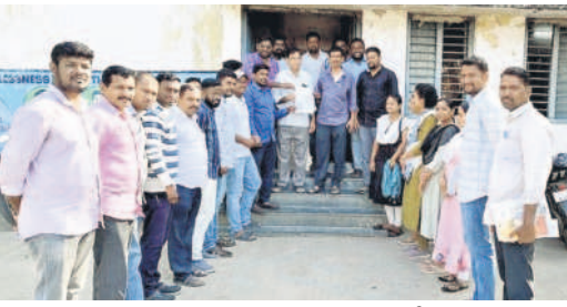
అధికారులకు వినతిపత్రం అందజేస్తున్న జేపీఎస్ లు