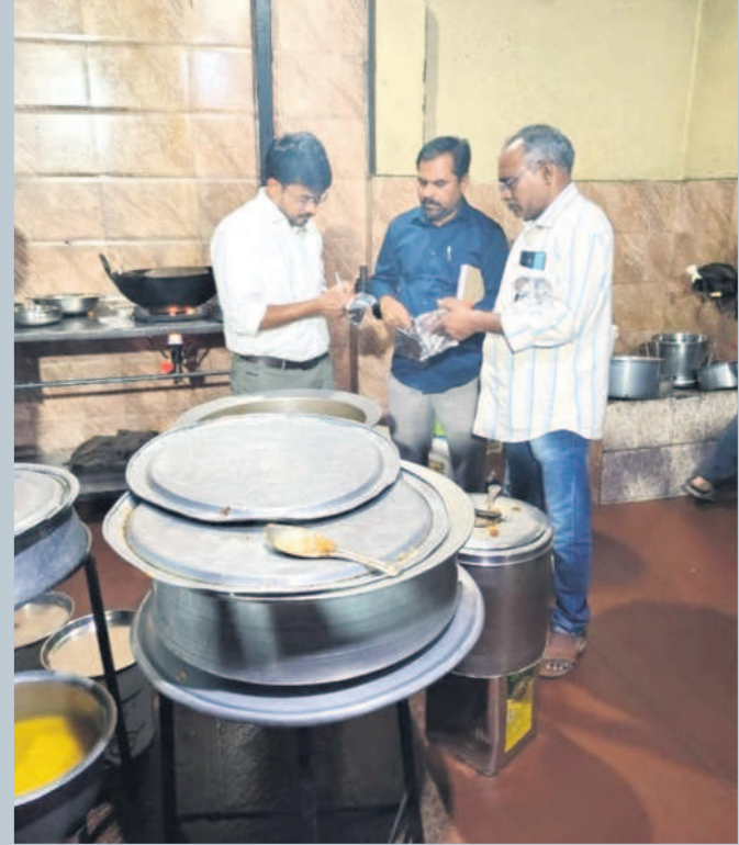
ఇటీవల ఓ వోటల్ లో తనిఖీలు నిర్వహిస్తున్న అధికారులు (బైల్)

బాసర, ఫిబ్రవరి 19 : బాసర రైల్వే స్టేషన్ ను బుధవారం దక్షిణ మధ్య రైల్వే జీఎం అరుణకుమార్ జైన్ సందర్శించారు. పలు రైల్వే స్టేషన్ల భద్రతా చర్యల్లో భాగంగా బుధవారం ప్రత్యేక రైలులో పలు రైల్వే స్టేషన్లను సందర్శించారు. ఇందులో భాగంగా ధర్నాబాద్, బాసర, నిజామాబాద్ రైల్వే స్టేషన్లను సందర్శించారు. బాసర రైల్వే స్టేషన్ ను సందర్శించి ప్రయాణికులకు ఏర్పాట్లు, భద్రతా చర్యల్లో లోటుపాట్లు లేకుండా చూసుకోవాలని ఆదేశించారు. అనంతరం నిజామాబాద్ రైల్వే స్టేషన్ కు వెళ్లారు.