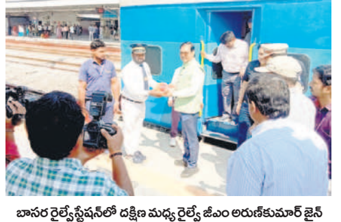
బాసర రైల్వే స్టేషన్ లో దక్షిణ మధ్య రైల్వే జీఎం అరుణకుమార్ జైన్

బాసర, ఫిబ్రవరి 19 : బాసర రైల్వే స్టేషన్ ను బుధవారం దక్షిణ మధ్య రైల్వే జీఎం అరుణకుమార్ జైన్ సందర్శించారు. పలు రైల్వే స్టేషన్ల భద్రతా చర్యల్లో భాగంగా బుధవారం ప్రత్యేక రైలులో పలు రైల్వే స్టేషన్లను సందర్శించారు. ఇందులో భాగంగా ధర్నాబాద్, బాసర, నిజామాబాద్ రైల్వే స్టేషన్లను సందర్శించారు. బాసర రైల్వే స్టేషన్ ను సందర్శించి ప్రయాణికులకు ఏర్పాట్లు, భద్రతా చర్యల్లో లోటుపాట్లు లేకుండా చూసుకోవాలని ఆదేశించారు. అనంతరం నిజామాబాద్ రైల్వే స్టేషన్ కు వెళ్లారు.