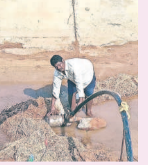
కాలిపోయిన మోటర్ను మార్చుతున్న రైతు

ఎల్లారెడ్డిపేట, ఫిబ్రవరి 19: ఎల్లారెడ్డిపేట మండల రైతులు ఆగమవుతున్నారు. సాగునీరు లేక పంటలు కాపాడుకునేందుకు తండ్లాడుతున్నారు. ఈ క్రమంలో రోడ్లెక్కి నిరసనలు కూడా తెలిపారు. దీంతో వారం క్రితం అధికారులు హడావిడి చేసి మల్కాపేట రిజర్వాయర్ నుంచి నీటిని కాలువలోకి వదలడంతో సంతోషపడ్డారు. సమీప ప్రాంత రైతులు ₹15వేల నుంచి ₹20వేలు ఖర్చు పెట్టి కాల్వలో మోటర్లు వేసి పొలాలకు పారిచే ప్రయత్నం చేశారు. అయితే కాలువలో అనుకున్న స్థాయిలో నీళ్లు రాక పొలాలకు నీళ్లు పెట్టేందుకు రాత్రిల్లా జాగ్రత్త చేస్తున్నారు. మోటర్లు కూడా మునిగే స్థాయిలో నీళ్లు రాక అవి కాలిపోతున్నాయని ఆవేదన చెందుతున్నారు. మూడు రోజుల నుంచి ఇదే పరిస్థితి ఉందని వాపోతున్నారు.