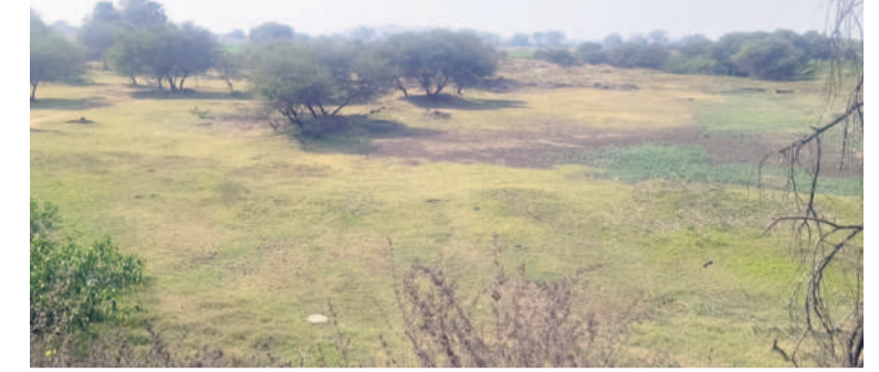
గంగాధర: చుక్కోరు లేని వెంకంపల్లి ఎగ్జిని కుంబ

ముడు గ్రామం.. వందలాది ఎకరాలు గంగాధర, ఫిబ్రవరి 19: పడేండ్లలో సాగునీటి గోస లేకుండా రైతులు సంబరంగా పంటలు సాగు చేశారు. కానీ, ఈ యేడాది సాగునీటి ప్రణాళిక లేక అక్షయకాలం పడుతున్నాయి. నారాయణపూర్ రిజర్వాయర్లో నిండుగా నీరున్నది. కానీ, అధికారుల పర్యవేక్షణ లేక ప్రయోజనం లేకుండా పోతున్నది. కొడిమ్యాల కొండపూర్ చెరువు