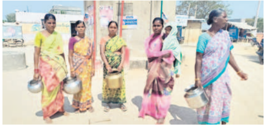
భారీ బిందెలతో నిరసన వ్యక్తం చేస్తున్న మహిళలు

వీరభద్ర, ఫిబ్రవరి 19: తాగునీటి సమస్యను పరిష్కరించాలని కోరుతూ మహిళలు బుధవారం రోడ్లెక్కినారు. నెలరోజులుగా తమకు సరిపడా తాగునీరు రావడం లేదని రాజన్న సిరిసిల్ల జిల్లా వీరభద్ర మండల కేంద్రంలోని ఎల్లమ్మ గుడి పరియ్యా వాసులు స్థానిక స్వయం సహాయక బృందానికి చిర సన వ్యక్తం చేశారు. డబుల్ రోడ్డు నిర్మాణ పనుల్లో పైవులైన్ ద్వారా నీరు వలె గడుస్తున్నా... ఇంతవరకు రివేర్ చేయలేదని మండిపడ్డారు. వారానికోసా పాట్యంకరతో అరకొరగా నీటిని సరఫరా చేస్తున్నారని.. అవి ఎటు సరిపోవడంలేదని అరోపించారు. బ్యాంకర్ ద్వారా సరఫరా చేస్తున్న నీటిలో చెత్త, నాచు పన్నునూయిని ఆవేదన వ్యక్తం చేశారు. ఇప్పటికైనా అధికారులు స్పందించి తాగునీటి సమస్యను పరిష్కరించాలని డిమాండ్ చేశారు.