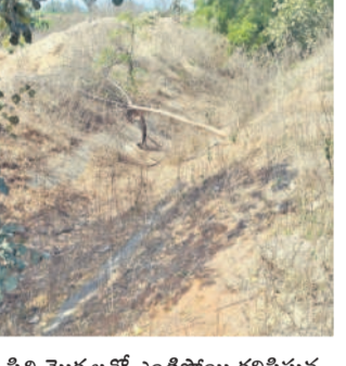
పిల్చిమొక్కలతో ఎండిపోయి కలిపిస్తున్న మల్లారూపి చెరువులోకి నీరు వచ్చే తెనాల

ముడు గ్రామం.. వందలాది ఎకరాలు గంగాధర, ఫిబ్రవరి 19: పడేండ్లలో సాగునీటి గోస లేకుండా రైతులు సంబరంగా పంటలు సాగు చేశారు. కానీ, ఈ యేడాది సాగునీటి ప్రణాళిక లేక అక్షయకాలం పడుతున్నాయి. నారాయణపూర్ రిజర్వాయర్లో నిండుగా నీరున్నది. కానీ, అధికారుల పర్యవేక్షణ లేక ప్రయోజనం లేకుండా పోతున్నది. కొడిమ్యాల కొండపూర్ చెరువు