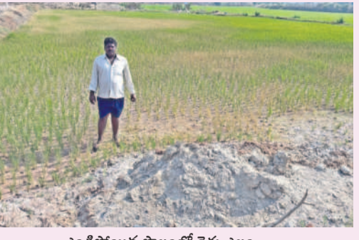
ఎండిపోయిన పొలంలో రైతు ఎల్లం

నాకు రాజన్నపేట జంగంబండ కింద బదికరాల పొలమున్నది. ఇప్పటివరకు లక్ష రూపాయలకు పైనే పెట్టుబడి పెట్టిన. పంట మంచిగ పండుతున్నానుంటే