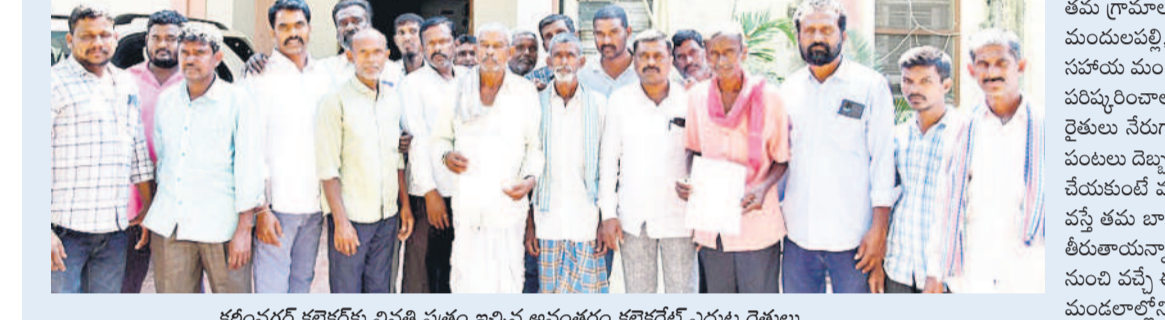
కరీంనగర్ కలెక్టర్ కు వినతి పత్రం ఇచ్చిన అనంతరం కలెక్టర్ కు ఎదుట రైతులు

డి-89 కాలువ చివరి ఆయకట్టులో ఎండిపోతున్న పంటలు ప్రశ్నార్థకంగా వందలాది ఎకరాలు ఆందోళనలో కరీంనగర్ రూరల్ మండల రైతులు