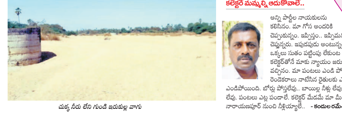
చుక్కోరు లేని గుండి ఇరుకులు వారు

కరీంనగర్, ఫిబ్రవరి 19 (నమస్తే తెలంగాణ) : సాగునీటి కలకలం రోజు రోజుకూ తీవ్ర రూపం దాల్చుతున్నది. పడేళ్ల పాటు ఏ రంది లేకుండా ఏటా రెండు పంటలు పండించిన రైతులు, గత రెండు సీజన్ల నుంచి అరిగోస పడల్ని వస్తున్నది. ప్రాజెక్టు ద్వారా నీళ్లు వస్తాయని ప్రభుత్వం, అధికారులు చేసిన ప్రకటనను నమ్మి వరి నాల్గు వేసిన అన్నదాతలు ఇప్పుడు నీటి కష్టాలు ఎదుర్కొంటున్నారు. ఇప్పటికే కరీంనగర్ రూరల్, గంగాధర, తిమ్మాపూర్ మండలాలలో పలు గ్రామాలలో చివరి ఆయకట్టుకు నీళ్లందక పంటలు ఎండిపోతుండగా, పంటలకు వదిలేస్తున్నారు. ఇప్పుడు సర్కార్ రెస్పాన్స్ పరిధిలోని డి-89 కాలువ చివరి ఆయకట్టు అయిన కరీంనగర్ రూరల్ మండలంలోని మొగ్గంపూర్, మందులపల్లి, నల్లగుంటపల్లి, చేగుర్తి, ఇరుకుల్ల గ్రామాలకు సీరందక తండ్లాడుతున్నారు. గడిచిన పదేళ్లలో సాగు నీటికి ఎలాంటి ఇబ్బందులు లేకుండా రైతులు ఏటా రెండు పంటలు పండించుకున్నారు. ఇరుకుల్ల వాగు ఒడ్డుకు ఉండే ఈ గ్రామాలకు గతంలో గంగాధర మండలం నారాయణపూర్ రిజర్వాయర్ నుంచి నీళ్లు వచ్చేవి. ఎల్లంపల్లి నుంచి నారాయణపూర్ రిజర్వాయర్ కు వెళ్లే పైన్