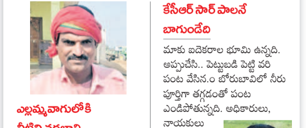
ఎల్లమ్మ వాగులోకి నీటిని వదలాలి

ముస్తాబాద్, ఫిబ్రవరి 19: బీఆర్ఎస్ పాలనలో మల్లన్నసాగర్ ప్రాజెక్టు కాలువల ద్వారా ముస్తాబాద్ మండల కేంద్రంలోని పెద్ద చెరువుకు నీళ్లు వచ్చేవి. ఆ తర్వాత ఎల్లమ్మ వాగుకు, అక్కడి నుంచి నక్కవారికు చేరింది. దాంతో రైతులకు సాగునీటి కష్టాలు ఉండేవి కాదు. కానీ, ఇప్పుడు ఆ పరిస్థితి లేదు. సాగునీరు రాకపోవడంతో ముస్తాబాద్ మండల రైతులు అరిగోసపడుతున్నారు. అధికారులకు విన్నవించినా పట్టించుకోవడం లేదని ఆవేదన వ్యక్తం చేశారు. రెండు, మూడు రోజుల్లో ఎల్లమ్మ వాగు, నక్క వాగులోకి నీరు విడుదల చేయకుంటే పోతుగడ్డ, గన్నెవానిపల్లె, నర్సంపాలతండా, మామిండ్లవాలపల్లె, నిమ్మలవారిపల్లె గ్రామాలలో పంటలు ఎండిపోతాయని ఆవేదన వ్యక్తం చేశారు. ఫిబ్రవరి రెండోవారంలోనే ఎండలు దంచికొట్టడంతో పంటపొలాలు ఎండుతున్నాయని, పొట్ల దళకు వచ్చిన పంటలు ప్రశ్నార్థకంగా మారుతున్నాయని ఆందోళన చెందుతున్నారు. ఈ పరిస్థితుల్లో అన్నదాతలు సాగునీటి కోసం భగీరథ ప్రయత్నాలు చేస్తున్నారు. లక్షలాది రూపాయలు వెచ్చించి బోర్లు వేస్తున్నా.. చుక్కోరు నీరు రావడంలేదని ఆవేదన వ్యక్తం చేస్తున్నారు. ఇప్పటికైనా అధికారులు స్పందించి సాగునీటి విడుదల చేయాలని కోరుతున్నారు.