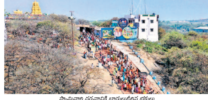
స్వామిలారా దర్శనానికి బాచులుబరిస భక్తులు