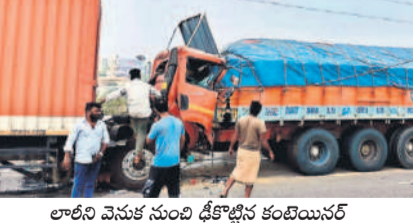
లారీని వెనుక నుంచి డిక్లొన్ కంట్రాక్టర్

నీలగిరి, ఫిబ్రవరి 19 : పాగమంచు కారణంగా జరిగిన ప్రమాదంలో ఇద్దరు దుర్మరణం చెందారు. నల్లగొండ టూటోన్ ఎస్ఎం రావుల నాగరాజు తెలిపిన వివరాల ప్రకారం.. నల్లగొండ పట్టణం శివారులోని అద్దకి-నార్కట్ పల్లి బ్రెస్ట్ మిడ్ సున్న ఫైటవర్క్స్ కట్టడ ప్రదేశం చెందిన లారీ చెన్నై నుంచి డిల్లీకి మండుల లోడ్తో వెళ్తున్నది. వెనుకనే చౌటుప్పల్లోని దివిడి కంపెనీకి చెందిన కంపెనీలో చీరా సుంది చౌటుప్పల్ కు వెళ్తున్నది. తెల్లవారుజామున 5.30గంటల సమయంలో డబ్బుగా పాగమంచు కమ్ముకుని ఉండడంతో యూపీకి చెందిన లారీ