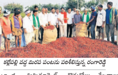
కల్లెట్టి వద్ద మిర్చి పంటను పరిశీలిస్తున్న రంగారెడ్డి

దామరపల్లె, ఫిబ్రవరి 19 : మిర్చి పంటకు కనీస ధర లేకుండా చేసి కేంద్ర, రాష్ట్ర ప్రభుత్వాల రైతుల కడుపు కొడుతున్నాయని, మిర్చికి కనీస మద్దతు ధరగా రూ.25వేలు ప్రకటించాలని మాజీ ఎమ్మెల్యే జూలకంటి రంగారెడ్డి డిమాండ్ చేశారు. మండలంలోని కల్లెట్టి, గాంధీనగర్ గ్రామాల్లోని మిర్చిపంటను బుధవారం ఆయన పరిశీలించారు. ఈ సందర్భంగా ఆయన మాట్లాడుతూ మిర్చిపంటకు గతేడాది క్వింటాకు రూ.25 వేలు ఉండగా నేడు రూ.12వేలకు పడిపోవడంతో రైతులు తీవ్రంగా నష్టపోతున్నారన్నారు. ఉమ్మడి నల్లగొండ జిల్లాలో