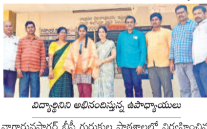
విద్యార్థిని అభినందిస్తున్న ఉపాధ్యాయులు

పెద్దపూర్, ఫిబ్రవరి 19 : మండలంలోని వెల్లుగూడెం జిల్లాపరిషత్ ఉన్న పాఠశాల విద్యార్థిని ఆదిపు వర్తి రాష్ట్ర స్థాయి కబడ్డీ పోటీలకు ఎంపికై సట్టు పాఠశాల ప్రధానోపాధ్యాయులు తీసుకువచ్చారు. బుధవారం పాఠశాలలో వర్తి నాలుగో