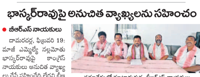
సమావేశంలో మాట్లాడుతున్న బీఆర్ఎస్ నాయకులు