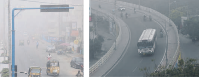
జిల్లా కేంద్రంలోని హైదరాబాద్ రోడ్డులో దారి కనిపించకుండా కురుస్తున్న మంచు