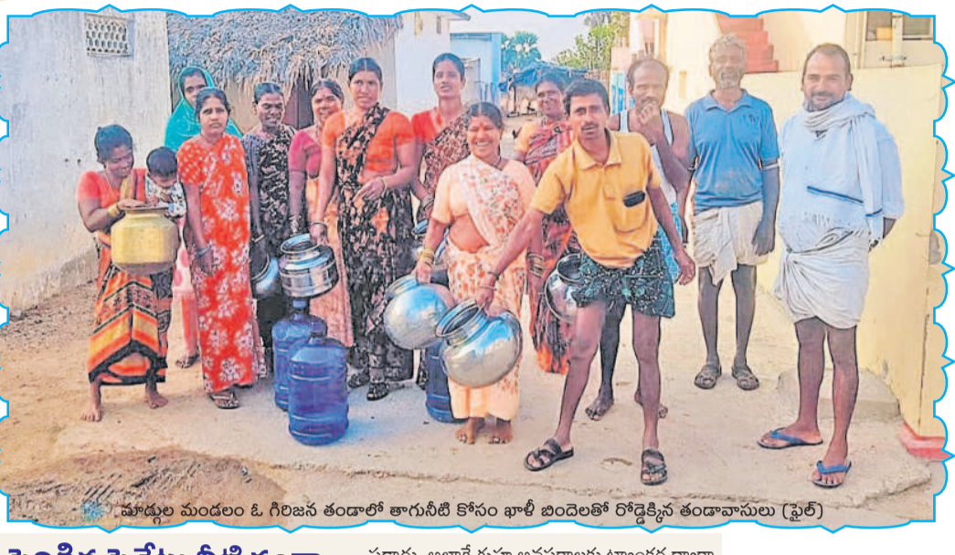
మాడ్గల్ మండలం ఓ గిరిజన తండాలో తాగునీటి కోసం ఖాళీ బిందెలతో రోడ్డికి వచ్చిన తండావాసులు (ఫైర్)

జిల్లాలోని 21 మండలాలకు ప్రతిరోజూ మిషన్ భగీరథ ద్వారా 106 ఎంఎల్ డీల కృష్ణా తాగునీరు సరఫరా చేస్తున్నారు. జిల్లాకు రోజుకు 108.37 ఎంఎల్ డీల తాగునీరు అవసరమండగా.. ప్రస్తుతం 106 ఎంఎల్ డీల నీరు మాత్రమే అందిస్తున్నారు. దీంతో జిల్లా డిమాండ్ కు తగ్గట్టు నీరు అందుతున్నది కాదు. జిల్లావ్యాప్తంగా 989 ఆవాసాలుండగా.. డిమాండ్ ను బట్టి ప్రతిరోజూ లేదా రోజు విడివిడి రోజు తాగునీరు అందించాల్సి ఉంటుంది. కానీ, మారుమూల ప్రాంతాలకు మాత్రం రెండు మూడు రోజులకోసారి మాత్రమే తాగునీరు వస్తున్నది ప్రజలు వాపోతున్నారు. అలాగే మండలాలలో వసతి గ్రామాలకు నీటి సరఫరా సరిగా జరగడంలేదని ప్రజలు ఆవేదన వ్యక్తం చేస్తున్నారు. మరోవైపు, గ్రామాల్లో బోరుబావులు, చేతిపంపులు వంటి వనరులు ఉన్నప్పటికీ వాటిని వాడకపోవడం వినియోగించడంలేదని. వచ్చే వేసవిలో చేతిపంపులు, బోరు బావులను వినియోగంలోకి తీసుకొచ్చి ప్రజలకు తాగునీటి ఇబ్బందులు తప్పకుండా జాగ్రత్తలు తీసుకోవడానికి అధికారులు సమూహకృతువుతున్నారు.