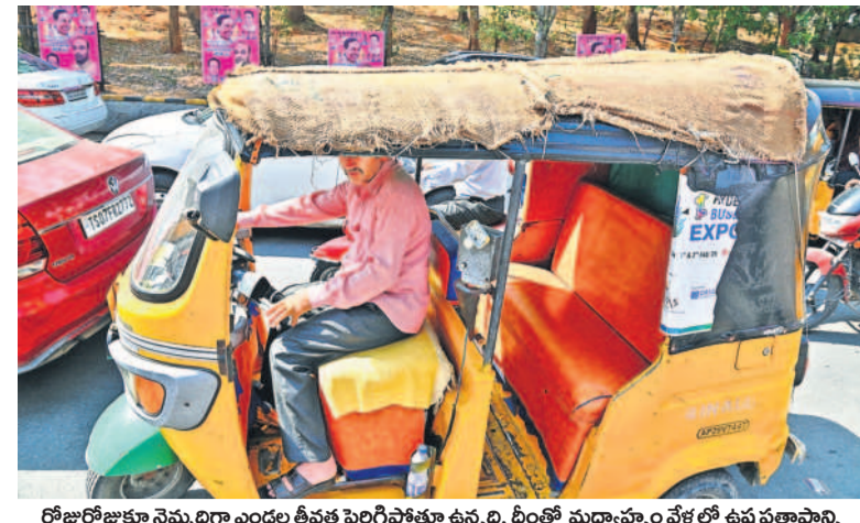
రోజురోజుకూ నమ్మదాగా ఎండల తీవ్రత పెరిగిపోతూ ఉన్నది, దీంతో మధ్యాహ్నం వేళల్లో ఉష్ణ ప్రతాపాన్ని తట్టుకునేందుకు ప్రత్యేక ఏర్పాట్లు చేసుకున్న ఓ టెలిఫోన్