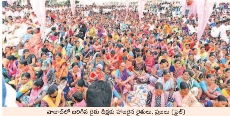
షాబాద్లో జరిగిన రైతు దీక్షలకు హాజరైన రైతులు, ప్రజలు (ఫైర్)