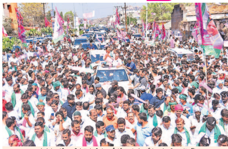
అమనగల్లులో జరిగిన రైతు దీక్ష రాష్ట్రంలో పాల్గొని అనేక జనవాహినీ (ఫైర్)