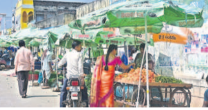
ఎండ వేడిమికి తాళలేక సూర్యాపేటలో గోదగులు ఏర్పాటు చేసుకున్న పిడి వ్యాపారులు

జిల్లాలో కరెంట్ కు డిమాండ్ పెరిగిపోయింది. ఎండలు విపరీతంగా కొడుతుండటంతో వివిధంగా విద్యుత్తును ఉపయోగిస్తున్నారు. గత నెలలో రోజుకు 8 మిలియన్ యూనిట్లు కరెంట్ వాడగా, ఇటీవల 9 మిలియన్ యూనిట్లు పెరిగింది. ఎండలు, ఉక్కుపోత దాటితే తాళలేక ప్రజలు ఏసీలు, కూల్డర్లు, ఫ్యాన్లు వినియోగిస్తున్నారు. ఈ నెలకొద్దీ 10 మిలియన్ యూనిట్లకు పెరిగే అవకాశం ఉందని అధికారులు అంచనా వేస్తున్నారు.