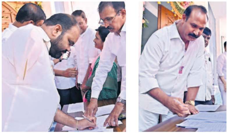
తెలంగాణ భవన్లో సమావేశం హాజరు లభిస్తున్న మాజీ ఎమ్మెల్యేలు, కంచర్ల భూపాలరెడ్డి, బీఆర్ఎస్ ముఖ్యమంత్రి యాదవ్