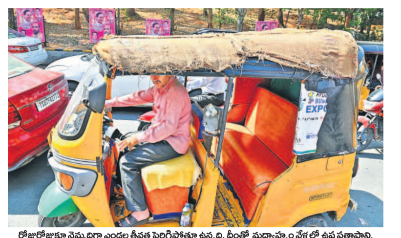
రోజురోజుకూ నెమ్మదిగా ఎండల తీవ్రత పెరిగిపోతూ ఉన్నది. దీంతో మధ్యాహ్నం వేళల్లో ఉష్ణ ప్రతాపాన్ని తట్టుకునేందుకు ప్రత్యేక ఏర్పాట్లు చేసుకున్న ఓ బీఆర్ఎస్

డిమాండ్ కు అనుగుణంగా నీటిని వదులుతున్న అధికారులు