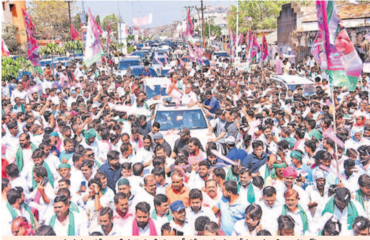
అమనగల్లులో జరిగిన రైతు దీక్ష రాష్ట్రంలో పాల్గొని అనేక జనవాహినీ (ఫైర్)