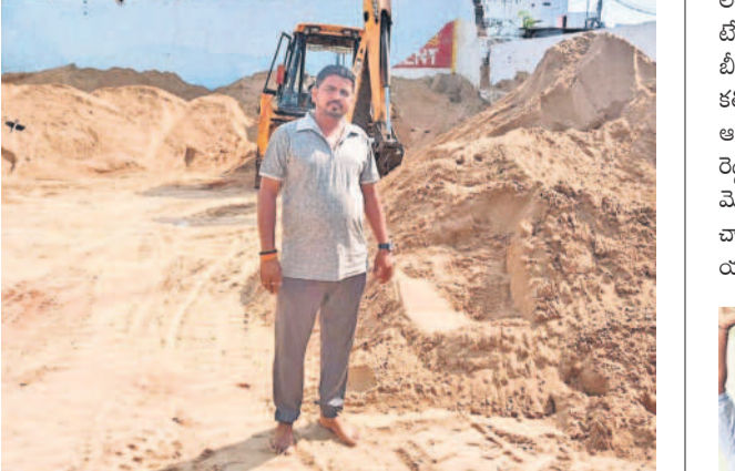
ఇసుక డంపులపై పోలీసుల దాడులు

జీహెచ్ఎస్సీ పరిధిలో జారీ అయ్యే బర్త్ అండ్ డెత్ సర్టిఫికేట్ల తప్పుల తడకగా ఉంటున్నాయి. దీంతో ధ్రువవత్రాలు పొందేవారికి ఇది ఇంకో సమస్యగా మారింది. ఒక్కో సర్టిఫికేట్ దాదాపు 500 నుంచి 700 వరకు కరెక్టర్ల పై పెండింగ్లో ఉండడం అధికారుల పనితీరుకు నిదర్శనంగా చెప్పవచ్చు. వాస్తవంగా జీహెచ్ఎస్సీ పరిధిలోని 30 సర్టిఫికేట్ల ప్రతి ఏటా గరిష్టంగా మూడున్నర లక్షల వరకు జననాలు జరుగుతున్నాయి. వీటిలో పైవేటి దవాఖానాల్లో జనరల్ చేస్టర్ల బర్త్ సర్టిఫికేట్ల తప్పులు తక్కువగా ఉంటుండగా.. ప్రభుత్వ అనుమతలతోనే నమోదవుతున్న ధ్రువవత్రాల్లో తప్పులు దొర్లుతున్నట్లు తెలుస్తున్నది. బర్త్, డెత్ సర్టిఫికేట్ల జారీకి సంబంధించిన రిజిస్ట్రార్లు స్థానిక మెడికల్ ఆఫీసర్ల వ్యవహారంపై ఉంటారు. కానీ చాలా సర్టిఫికేట్ మెడికల్ ఆఫీసర్లు లేకపోవడంతో అసిస్టెంట్ మెడికల్ కమిషనర్లు (ఎంఎన్సీ)లను బర్త్, డెత్ రిజిస్ట్రార్లుగా నియమించారు. ఈ నేపథ్యంలోనే బేగంపేట సర్టిఫికేట్ల పరిధిలోని గాంధీ ఆసుపత్రి, గోపాల్ నగర్ సర్టిఫికేట్ల పరిధిలోని సుల్తాన్ బజార్ ప్రభుత్వ దవాఖాన, పేట్ బురుజులోని సర్కారు వెలర్సర్ల హాస్పిటల్, మెహిది పట్నం సర్టిఫికేట్ల పరిధిలోని దవాఖాన పరిధిలో భారీగా కరెక్టర్ల పై పెండింగ్లో ఉన్నట్లు సమాచారం.