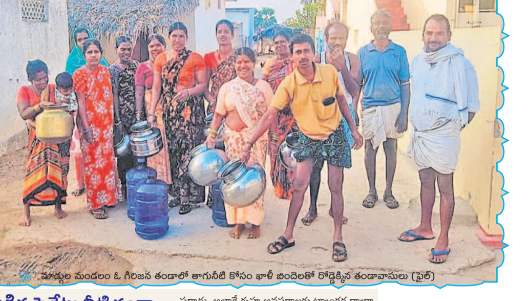
మాడ్గల్ మండలం ఓ గిరిజన తండాలో తాగునీటి కోసం ఖాళీ బిందెలతో రోడ్డుకి వచ్చిన తండావాసులు (ఫైర్)

జిల్లాలోని 21 మండలాలకు ప్రతిరోజూ మిషన్ భగీరథ ద్వారా 106 ఎంఎల్ డీల కృష్ణా తాగునీరు సరఫరా చేస్తున్నారు. జిల్లాకు రోజుకు 108.37 ఎంఎల్ డీల తాగునీరు అవసరమవుతోంది.. ప్రస్తుతం 106 ఎంఎల్ డీల నీటిని మాత్రమే అందిస్తున్నారు. దీంతో జిల్లా డిమాండ్ కు తగ్గట్టు నీరు అందడం తలెత్తుతున్నాయి. జిల్లావ్యాప్తంగా 989 ఆవాసాలిండ్లు.. డిమాండ్ ను బట్టి ప్రతిరోజూ లేదా రోజు విడివిడి రోజు తాగునీరు అందించాల్సి ఉంటుంది. కానీ, మూడుమూల ప్రాంతాలకు మాత్రం రెండు మూడు రోజులకోసారి మాత్రమే తాగునీరు వస్తున్నదని ప్రజలు వాపోతున్నారు. అలాగే మండలాల్లోని వనరుల గ్రామాలకు నీటి సరఫరా సరిగ్గా జరగడంలేదని ప్రజలు ఆవేదన వ్యక్తం చేస్తున్నారు. మరోవైపు, గ్రామాల్లో బోరుబావులు, నీటిపంపులు వంటి వనరులు ఉన్నప్పటికీ వాటిని వాడకపోవడం వినియోగించడంలేదని. వచ్చే వేసవిలో చేతిపంపులు, బోరు బావులను వినియోగంలోకి తీసుకొచ్చి ప్రజలకు తాగునీటి ఇబ్బందులు తప్పకుండా జాగ్రత్తలు తీసుకోవాలని అధికారులు సూచిస్తున్నట్లు తెలుస్తున్నాయి.