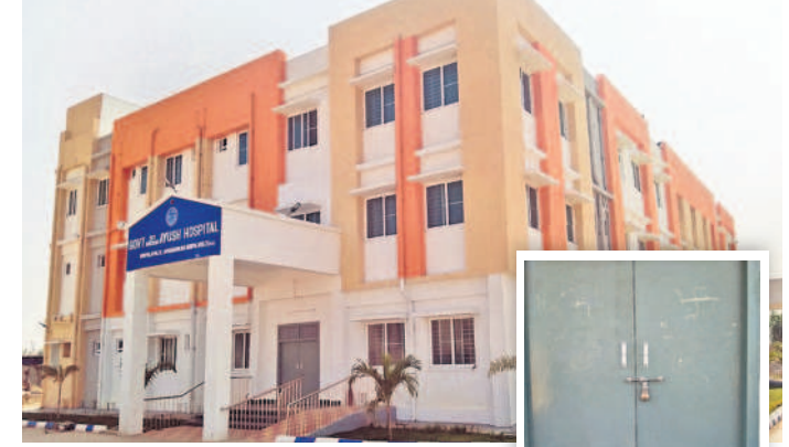
భూపాలపల్లిలో నిర్మించిన ఆయుష్ ఇంటిగ్రేటెడ్ దవాఖాన భవనం, (ఇన్ సైట్) దవాఖానకు వేసిన తాళం

జయశంకర్ భూపాలపల్లి, ఫిబ్రవరి 19 (నమస్తే తెలంగాణ) : ఆయుష్ వైద్యం అందని ప్రాథమిక దవాఖానం. ఉమ్మడి జిల్లాలో కేవలం వరంగల్లో మాత్రమే ఆనంతలక్ష్మి ఆయుష్ వైద్యం అందుబాటులో ఉండగా ప్రజలకు అనుబంధం. ఆయుష్ సేవలను సాగునీటి శాఖ అనుబంధంగా చేసుకుంటున్నారు. రాష్ట్రవ్యాప్తంగా ఎక్కడా ఆయుష్ ఇంటిగ్రేటెడ్ దవాఖానం లేవు. ఈ క్రమంలో ఆయుష్ వైద్యం సేవలను విస్తరించాలనే ఆలోచనలో గత ఏడాది సర్కారు కేంద్ర ప్రభుత్వంపై ఒత్తిడి తెచ్చి జయశంకర్ భూపాలపల్లి, వికారాబాద్, సిద్దిపేట జిల్లాలకు ఒక్కో భవనానికి రూ. 10 కోట్లతో మూడు 50 పడ కల ఆయుష్ ఇంటిగ్రేటెడ్ దవాఖాన భవనం నిర్మించింది. కాగా ఆయుష్ భూపాలపల్లి జిల్లాలో డిసెంబర్ 14న వైద్య ఆరోగ్యశాఖ మంత్రి దామోదర రాజనర్సింహు ఈ దవాఖాన భవనాన్ని ప్రారంభించి చేతులు వేసాడు. రెండు నెలలపాటు నిర్మాణం జరిగింది. ఇక్కడ కేంద్రం, మెడిసిన్, స్టాఫ్ కూడా రాబోయింది. ఇదిలా ఉండగా కేంద్రం