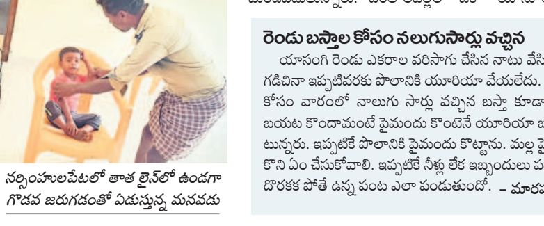
నర్సంపాలపేటలో తాత లైన్ లో ఉండగా గోడవ జరుగడంతో ఏడుస్తున్న మనవడు

తొర్రూరు/నర్సంపాలపేట/ఖానాపూర్/దంతాలపల్లి, ఫిబ్రవరి 19 : యూరియా కోసం రైతులకు తిప్పలు తప్పడం లేదు. సరిపడ దొరకకపోవడంతో పనులు మానుకొని ఎదురుపల దుకాణాల చుట్టూ తిరుగుతూ గంటల కొద్దీ బారులు తీరారు. బుద్ధవారం మహా బూటాబాద్ జిల్లా నర్సంపాలపేట, దంతాలపల్లి, వరంగల్ జిల్లా ఖానాపూర్ మండల కేంద్రంలోని అగ్రో, పీసీఎస్ గోదాముల వద్ద యూరియా బస్టాప్ కోసం పోటీపడ్డారు. వైసీపీ కన్నవారికి కాకుండా వైసీపీకారులకు పెద్ద ఎత్తున యూరియా అమ్మకమైనా, కడయం వంద బస్టాప్ ఉంటే 30మంది