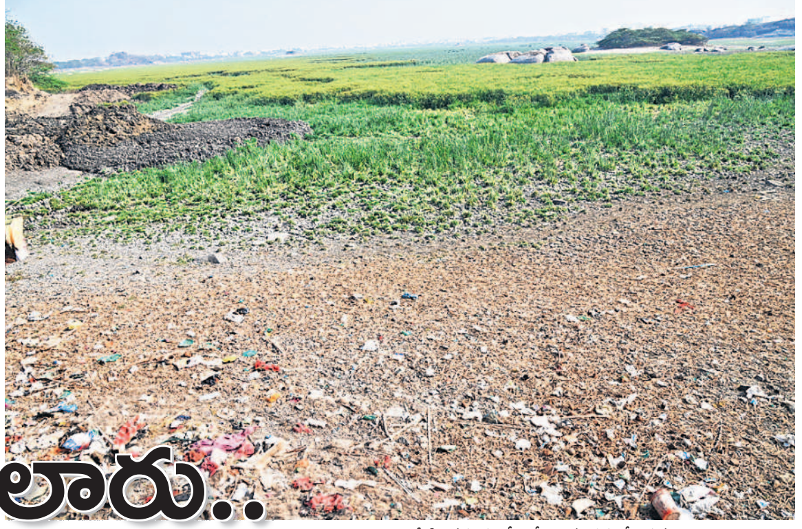
నీటిని వదలడంతో ఖాళీగా ఉన్న భద్రకాళి చెరువు

- వరంగల్, ఫిబ్రవరి 19 (నమస్తే తెలంగాణ ప్రతినిధి)