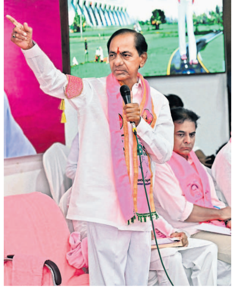
తెలంగాణ భవన్లో బీఆర్ఎస్ విస్తృత స్థాయి సమావేశంలో బీసా నిర్దేశం చేస్తున్న పార్టీ అధినేత కేసీఆర్