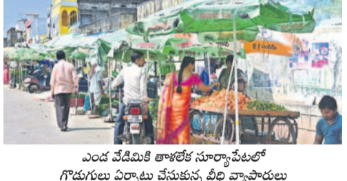
ఎండ వేడిమికి తాళలేక సూర్యాపేటలో గొడగులు ఏర్పాటు చేసుకున్న బిబి వ్యాపారులు

జిల్లాలో కరెంట్ కు డిమాండ్ పెరిగిపోయింది. ఎండలు విపరీతంగా కొడుతుండటంతో విరివిగా విద్యుత్తును ఉపయోగిస్తున్నారు. గత నెలలో రోజుకు 8 మిలియన్ యూనిట్ల కరెంట్ వాడగా, ఇటీవల 9 మిలియన్ యూనిట్లకు పెరిగింది. ఎండలు, ఉక్కపోత దాటికి తాళలేక ప్రజలు ఏసీలు, కూల్డర్లు, ఫ్యాన్లు వినియోగిస్తున్నారు. ఈ నెలకొద్దంలో 10 మిలియన్ యూనిట్లకు పెరిగే అవకాశం ఉందని అధికారులు అంచనా వేస్తున్నారు.