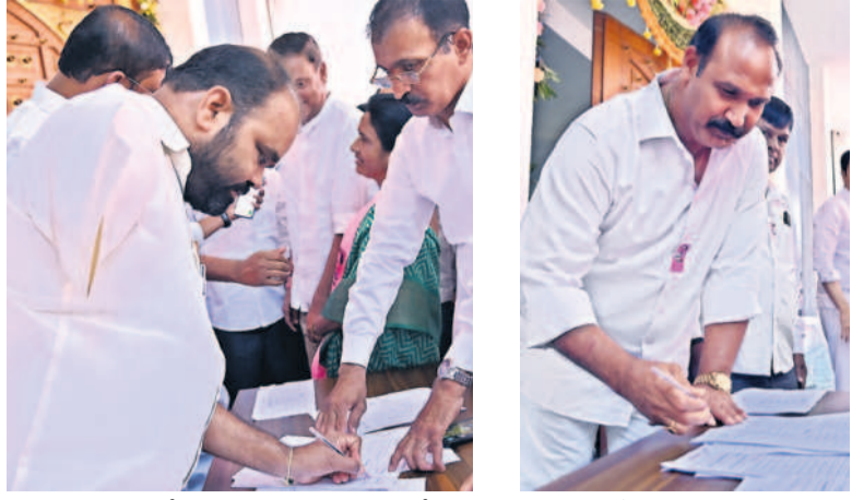
తెలంగాణ భవన్లో సమావేశం హాజరు లభిస్తున్న మాజీ ఎమ్మెల్యేలు, కంచర్ల భూపాలిరెడ్డి, బీఆర్ఎస్ ముఖ్యమంత్రి యాదాద్రి