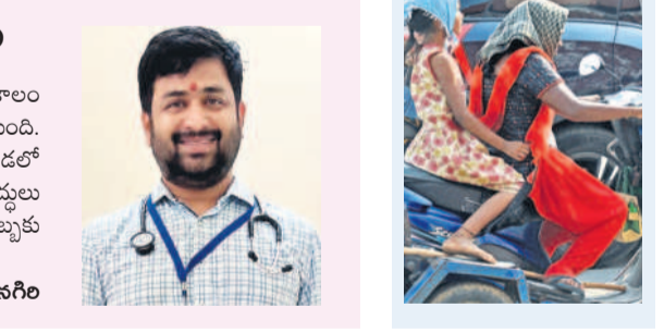
పది రోజుల్లో నమోదైన ఉష్ణోగ్రతలు

ఎండలు ఎక్కువగా ఉండటంతో తక్కువగా జాగ్రత్తలు తీసుకోవాలని డాక్టర్లు సూచిస్తున్నారు. ఆరు బయట పనిచేసే వారు సూర్యరశ్మి కాపాడుకునేలా జాగ్రత్త పడాలి. తరుచూ నీళ్లు తాగాలి. ఎక్కువగా నిమ్మరసం, కొబ్బరి నీళ్లు లాంటి ద్రవ పదార్థాలు తీసుకోవాలి. తెలుపు రంగు, లేత రంగులు వలువలు కాటన్ వస్త్రాలు ధరించాలి. తలకు వేడి తలకండా టోపీ పెట్టుకోవాలి. ఓఆర్ఎస్ ద్రావణం తాగితే వడదెబ్బ నుంచి కాపాడుకోవచ్చు. చంటిపిల్లలు, గర్భిణులు, వృద్ధులు, అనారోగ్యంతో ఉన్న వారు వడగాల్లులకు గురికాకుండా ప్రత్యేక శ్రద్ధ తీసుకోవాలి. వడదెబ్బకు గురైన వారిని ప్రాథమిక చికిత్స అనంతరం స్థానిక ఆరోగ్య కేంద్రానికి తీసుకోవాలి. కాఫీలు, టీలు అధిక వేడి సమయంలో తీసుకోకూడదు.