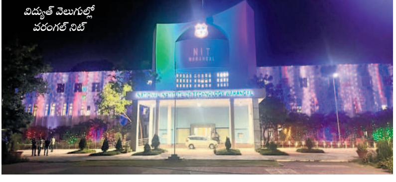
విద్యుత్ వెలుగుల్లో వరంగల్ నిజ్

■ నిల్దేలి మూడు రోజుల పాటు మహోత్సవం ■ పాణంకానున్న పద్మశ్రీ బ్రహ్మనందం సంగీతం, నృత్యం, కళలు, వినోదం వంటి రంగాల్లో ప్రతిభను వెలికితీసేందుకు స్ప్రింగ్ స్త్రీ దక్షిణ భారత దేశంలోని ప్రముఖ కళాశాలల వార్షికోత్సవాల్లో ఒక టీగా పాల్గొంది. దేశవ్యాప్తంగా విద్యార్థులు, కళా కారులు, ప్రదర్శకులు పెద్దఎత్తున ఈ మహోత్సవా నికి హాజరవుతారు. పోటీలు, వర్కషాపులు, ప్రో షోలు ప్రేక్షకులను మంత్రముగ్ధుల్ని చేయనున్నాయి. అనేక కార్యక్రమాలతో యువతలోని ప్రతిభను, సృజనాత్మకతను వెలికితీసే వేడుకలో పరిపతక ఆస్వాదనం చేసేందుకు పద్మశ్రీ బ్రహ్మనందం ముఖ్య అతిథిగా హాజరుకానున్నారు. తన అమోఘమైన హాస్యంతో కోట్లాది మంది హృదయాలను గెలుచుకున్న సినీ నటుడు, కమెడియన్ బ్రహ్మనందం స్ప్రింగ్ స్త్రీ వేదికపై సందడి చేయనున్నారు.