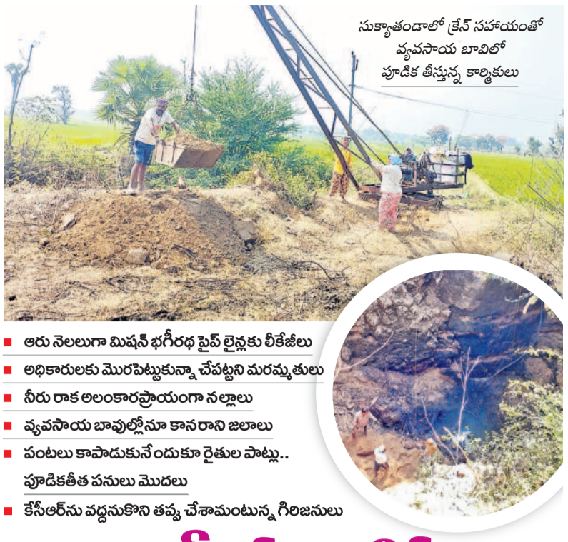
సుక్యాతండాలో క్రేన్ సహాయంతో వ్యవసాయ బావిలో పూడిక తీస్తున్న కార్మికులు