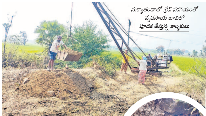
సుక్యాతండాలో క్రేన్ సహాయంతో వ్యవసాయ బావిలో పూడిక తీస్తున్న కార్మికులు