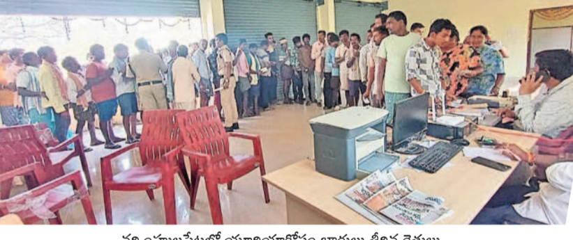
నర్సింహపేటలో యూరియాకోసం బారులు తీరిన రైతులు