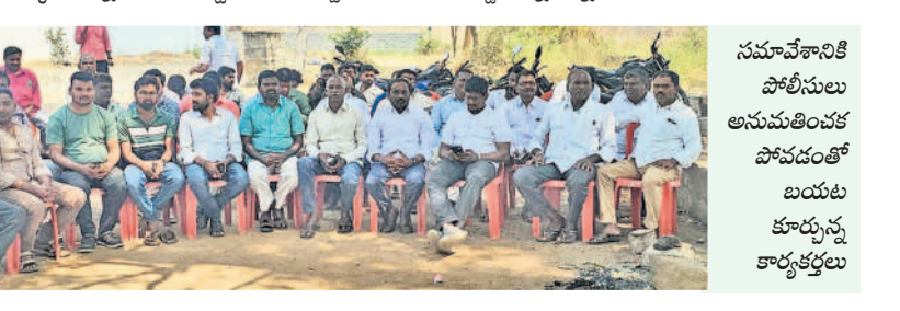
సమావేశానికి పోలీసులు అనుమతించక పోవడంతో బయటకు కూర్చున్న కార్యకర్తలు