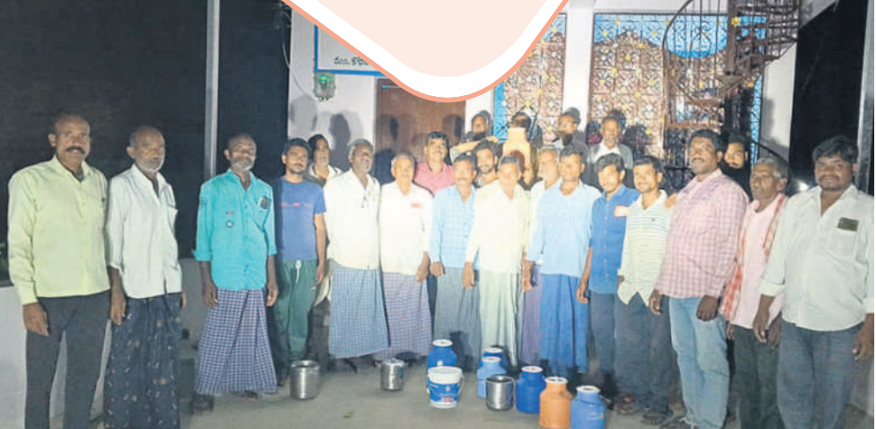
కొనరావుపేట: కనగల్లిలో పాలకేంద్రం ఎదుట పాల డబ్బాలతో నిరసన తెలుపుతున్న రైతులు