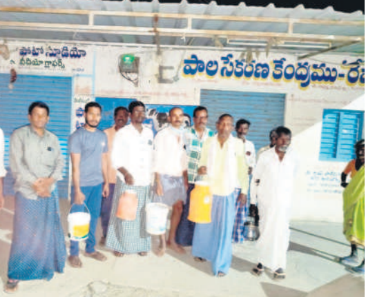
ఇల్లంతకుండు: రేపాకలో నిరసన తెలుపుతున్న రైతులు