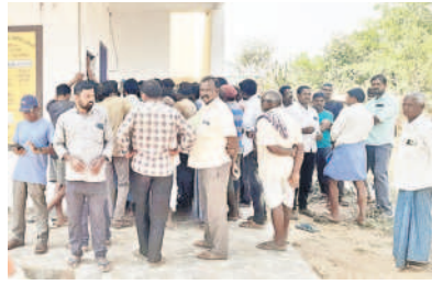
కోరుట్లరూరల్: మాదాపూర్లోని సహకార సంఘం వద్ద యూరియా కోసం బారులు తీరిన రైతులు

ధర్మపురి/ కోరుట్ల రూరల్, ఫిబ్రవరి 20: యూరియా పూల యూరియా కష్టాలు తీవ్రమయ్యాయి. రైతులకు కంటిమీద కునుకులేకుండా చేస్తున్నాయి. ప్రభుత్వ నిర్లక్ష్యం.. అధికారుల పట్టిన పులెమిటో సాస్టెబిల్ వద్ద రోజంతా పడిగాపులు పడుతున్నా ఒక్క బస్తా దొరకడం లేదు. ఇందుకు జగిత్యాల జిల్లా ధర్మపురి మండలం జైన్, కోరుట్ల మాదాపూర్ సహకార సంఘాలే నిదర్శనంగా నిలుస్తున్నాయి. ధర్మపురి మండలం జైన్ సహకార పరపతి సంఘం గోదాముకు వారం రోజులుగా యూరియా రావడం లేదు. గురువారం 340 బస్తాల రోడ్