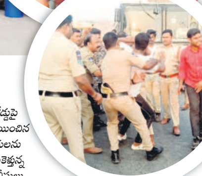
రోడ్లపై బైరాయిందిన రైతులను తీసుకెళ్తున్న పోలీసులు