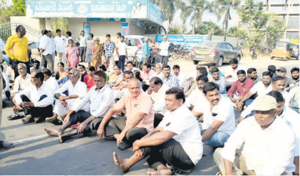
సిరిసిల్ల-కరీంనగర్ రూరాలపై ధర్నా చేస్తున్న పాడిరైతులు

అగ్రహారంలో రైతులు మూడుగంటల పాటు ఆందోళన చేయగా, పోలీసులను పెట్టి విరమించు జేశారు. కానీ, సాయంత్రం పాలకేంద్రాల వద్ద మెజిస్ట్రేట్ గ్రామాల రైతులు ఆందోళనతో హోరెత్తించారు. ప్రభుత్వం, అధికారులతోపాటు కలెక్టరేట్కు వ్యతిరేకంగా నిరసన తెలిపారు. అలాగే శుక్రవారం ఆందోళన మరొక తీవ్రం చేయాలని, కలెక్టరేట్ను ముట్టడించాలని నిశ్చయించారు. ఆ మేరకు అన్ని పాడి సహకార సంఘాలకు సమచారం ఇచ్చారు. సీజ్ చేసిన చిల్డింగ్ సెంటర్ను తెరిచే వరకు కలెక్టరేట్ నుంచి కడలేదని నిర్ణయం తీసుకున్నారు. రైతుల ఆందోళన ఉగ్రరూపం దాల్చుతున్నదని విషయం తెలియడంతో అధికారులు దిగివచ్చారు. అధికార పార్టీ నాయకులు.. కలెక్టరేట్ మాట్లాడుతూ, రాత్రి తొమ్మిది గంటల సమయంలో ప్రభుత్వ బస్ అధిష్టినీ వాస్ సమకల్లో పంచాయతీ కార్యదర్శి సీజ్ను తొలగించి, చిల్డింగ్ సెంటర్ను ఓపెన్ చేశారు అయితే రైతుల ఆందోళన తీవ్రమైతే ప్రభుత్వానికి, పార్టీకి చెడ్డమేర తెస్తుందన్న భయంతోనే ఈ నిర్ణయం తీసుకున్నారన్న ఆభిప్రాయాలు వ్యక్తమయ్యాయి. ఇది ఇలాగే కొనసాగిస్తారా.. లేక రైతుల ఉద్యమం చల్లారగానే, మళ్లీ సీజ్ చేస్తారా..? ఎన్నో అనుమానాలు కూడా వస్తున్నాయి.