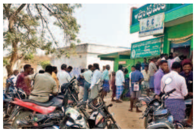
ధర్మపురి: జైన్ సహకార సంఘం ఎదుట.. టోకెన్ కోసం క్యూరైన్ కట్టారు. రోజంతా పడిగాపులు కాసినా కొండరికే యూరియా అందడంతో మిగిలిన వారు ఆసహనం వ్యక్తం చేశారు. అధికారులు పూర్తిస్థాయిలో స్టాక్ తెప్పించకపోవడంతోనే ఇలాంటి పరిస్థితి వచ్చిందన్నారు.

వచ్చినా 25శాతం రైతులకు కూడా సరిపోలేదు. యూరియా పంపిణీ ట్రెంట్ రైతులు ఎగబడ్డారు. అధికారులు పోలీసుల సాయంతో పంపిణీ చేయాలని వచ్చింది. అందరికీ అందకపోవడంతో రైతుల ఆగ్రహం వ్యక్తం చేశారు. అయితే పలుకుబడి ఉన్నా క్షేత్ర బస్తాలు ఇస్తున్నారని, ఇదికంటే పట్టి అంటూ పలువురు రైతులు హుమాలీలతో గొడవకు దిగారు. ఇక కోరుట్ల మండలం మా దాపూర్లోని ప్రాథమిక సహకార సంఘ కార్యాలయం వద్ద యూరియా కోసం పెద్ద సంఖ్యలో రైతులు బారులు తీరారు. పట్టా పాను పుస్తకాలతో సహకార సంఘం వద్ద