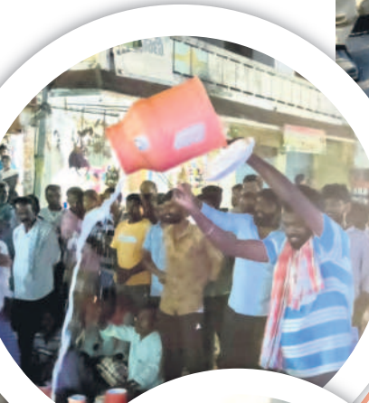
రోడ్లపై పాలను పారబోస్తున్న రైతు