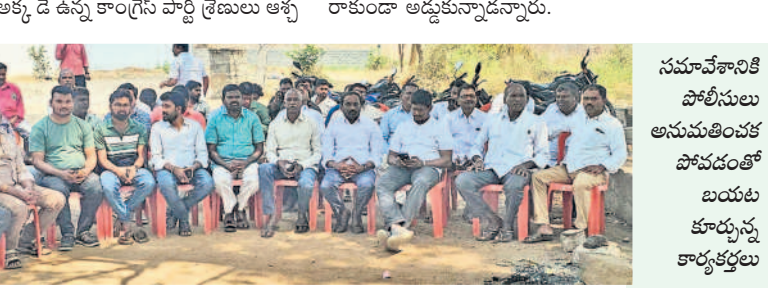
సమావేశానికి పోలీసులు అనుమతించక పోవడంతో బయటకు కూర్చున్న కార్యకర్తలు