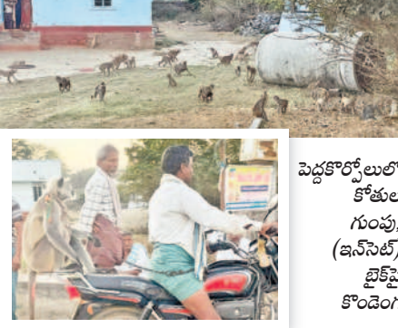
పెద్దకోర్ట్ లులో కోతుల గుంపు, (ఇన్ సెట్) క్రైస్టి కోండెంగ

నేకొండ మండలం పెద్దకోర్ట్ లులో కోతుల బెడద తీవ్రంగా ఉంది. ఇటు గ్రామ ప్రజలును, పంట చేస్తూ ఉన్న చేస్తుండడంతో సూరం జిగన్ అనే రైతు డా. 6వేలకు ఓ కొండెంను కొని గ్రామ పంచాయతీకి అప్పగించారు. ఇక అప్పటినుంచి ఆ కొండెం గను ఇలా బ్రేక్ చేస్తే వద్దకు, ఊళ్లో తిప్పుతుండడంతో దానిని చూసి కోతులు వదలవుతున్నాయి.