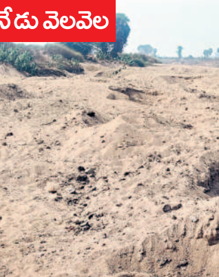
అడుగుంటి ఆకేరు వారు సాగునీరందింపక రైతుల అరిగిన