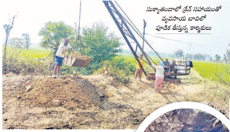
సుకాంతండాలో క్రేన్ సహాయంతో వ్యవసాయ బావిలో పూడిక తీస్తున్న కార్మికులు