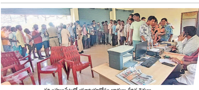
నర్సింహపేటలో యూరియా కోసం బారులు తీరిన రైతులు