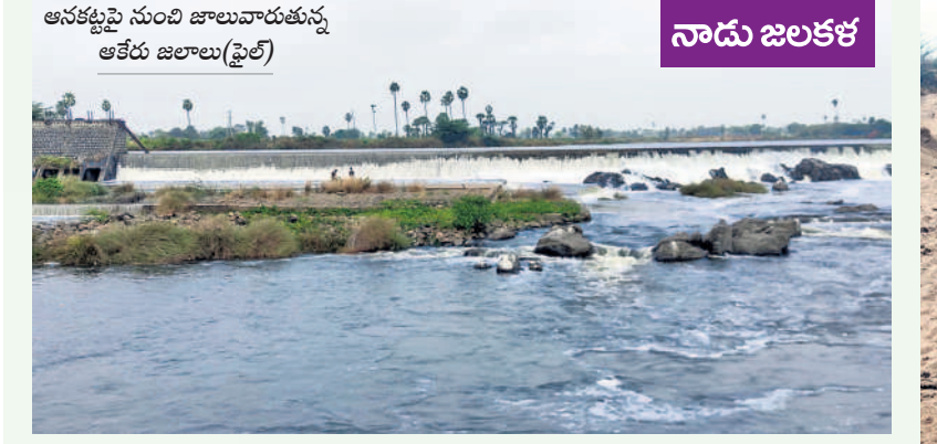
ఆనకట్టపై నుంచి జూలువారుతున్న ఆకేరు జలాలు(ఫైల్)

10 వరంగల్, శుక్రవారం 21 ఫిబ్రవరి 2025 WARANGAL