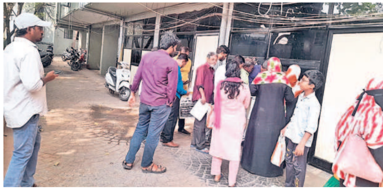
గృహ జ్యోతి, గృహస్థలకు సమస్యలపై దరఖాస్తు చేసేందుకు వచ్చిన ప్రజలు