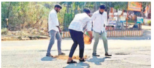
రోడ్డుపై ఏర్పడిన గుంతలను పూడ్చుతున్న డివైఎఫ్ఐ నాయకులు