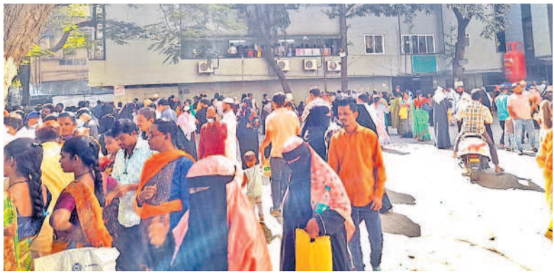
కలెక్టరేట్ ప్రాంగణంలో పడిగాపులుగాస్తున్న దరఖాస్తుదారులు