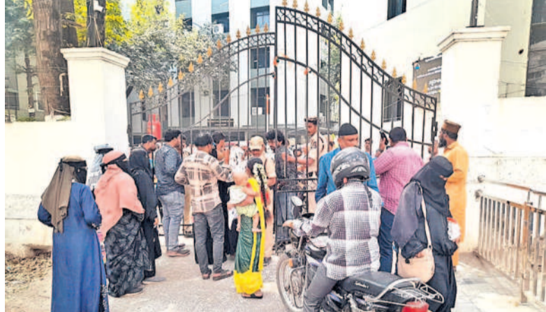
దరఖాస్తుల స్వీకరణకు సమయం ముగియడంతో గేటు ఎదుట వేచిచూస్తున్న అర్హులందరూ

ఖాతాలో జమకావడం లేదని ప్రజలు నిట్టూరుస్తున్నారు. చేసేదేమీలేక గ్యాస్ బుక్కులు, అధార్, బ్యాంకు పాస్ బుక్ జిరాఫ్ట్ లతో నగర ప్రజలు కలెక్టరేట్ చుట్టూ తిరుగుతున్నారు. సబ్సిడీ డబ్బులు రాకపోకలతో తీసుకోవడం వరకే అని చెప్పడంతో ప్రజలు అయోమయానికి గురవుతున్నారు. రేషన్ కార్డులు, ఇందిరపంపు ఇండ్ల తమకు వస్తాయా? రావా? వస్తే ఎప్పుడు వస్తాయి? అనే ప్రశ్నలతో సతమతమవుతున్నారు. గృహజ్యోతి పేరుతో 2 00 యూనిట్ల కంటే ఎక్కువ ప్రకటింపి కొంతమందికి వర్తింపజేసింది. గృహలక్షి పేరుకు రూ.500 లతో గ్యాస్ సిలిండర్ ఇస్తామని.. మిగతా డబ్బు లబ్ధిదారుల ఖాతాలో వేస్తామని చెప్పారు. సబ్సిడీ డబ్బులు మూడు నెలలుగా రావడంలేదని ప్రజలు ఆవేదన వ్యక్తం చేస్తున్నారు. ప్రతి పథకంలో ఏదో ఒక సమస్య ఉండటంతో జిరాఫ్ట్ పేపర్లు పట్టుకుని ప్రజలు కలెక్టరేట్ చుట్టూ ప్రదక్షిణలు చేస్తున్నారు. కాంగ్రెస్ ప్రభుత్వ ఆసపమంతులను ప్రభుత్వం ప్రకటించడంతో ప్రజలు ఆయోమయానికి గురవుతున్నారు.