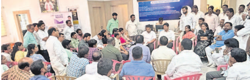
బోయినపల్లిలోని క్యాంపు కార్యాలయంలో నీటి సమస్యపై అధికారుల సమీక్షలో మాట్లాడుతున్న ఎమ్మెల్యే మల్కాజగిరి రైల్వే

మల్కాజగిరి ఫిబ్రవరి 21: రానున్న ఎండాకాలంలో ప్రజలకు నీటికి ఇబ్బందులు రాకుండా ముందస్తు చర్యలు తీసుకుంటున్నామని ఎమ్మెల్యే మల్కాజగిరి రైల్వే అన్నారు. శుభ్రవారం బోయినపల్లిలోని క్యాంపు కార్యాలయంలో నీటి సమస్యపై వాటర్లవర్గం అధికారులతో ఎమ్మెల్యే సమీక్ష సమావేశం నిర్వహించారు.