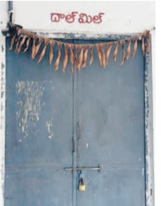
మాతలదేని తిర్యగిలోని దారీమిల్ మానిసి, వాంకిడీలోని దారీమిల్