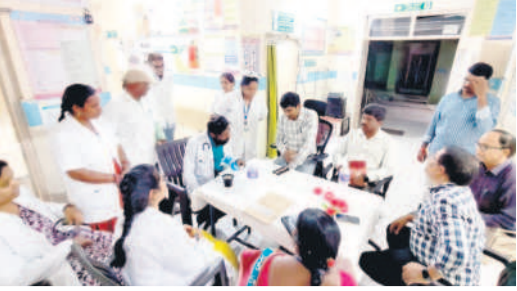
అగ్రాజీపల్లె వీహెచ్సీని పరిశీలించు కేంద్ర బృందం సభ్యులు