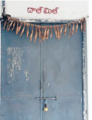
మాతబడిని తిర్యగిలోని దారీమిల్ మాసి సెన్, వాంకిడీలోని దారీమిల్