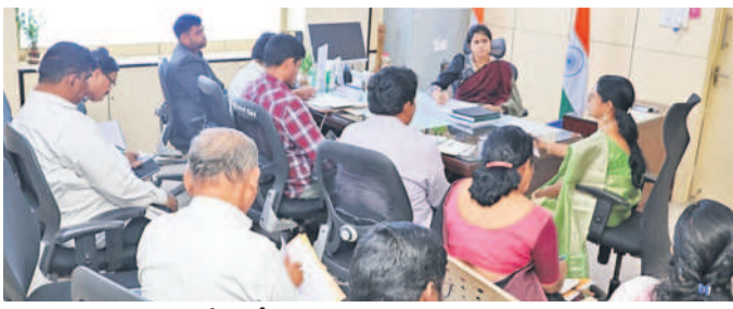
సమావేశంలో మాట్లాడుతున్న కలెక్టర్ వల్లూరు క్రాంతి