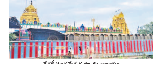
కేతకీ సంగమేశ్వర స్వామి ఆలయం