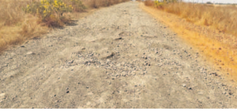
రుక్మావతి, సిద్ధాపూర్ మీదుగా ఆలయానికి వచ్చే రహదారి

మహాశివరాత్రి బ్రహ్మోత్సవాలకు ఇబ్బందులు కలగకుండా పాలక వర్గం అన్ని ఏర్పాట్లు చేస్తుంది. గతేడాది నుంచి పాలకవర్గం లేకపోవడంతో అధికారులు ఉత్సవాలకు ఏర్పాట్లు చేస్తున్నారు. కేతకీ ఆలయ పాలక మండలి ఏర్పాటు చేయాలని డిమాండ్, దర్బారులు శాఖ అధికారులు నాలుగు నెలల క్రితమే నోటిఫికేషన్ వేసినప్పటికీ ఇప్పటి వరకు పాలక మండలి ఏర్పాటు చేయలేదు. ఆలయ చైర్మన్ పదవి