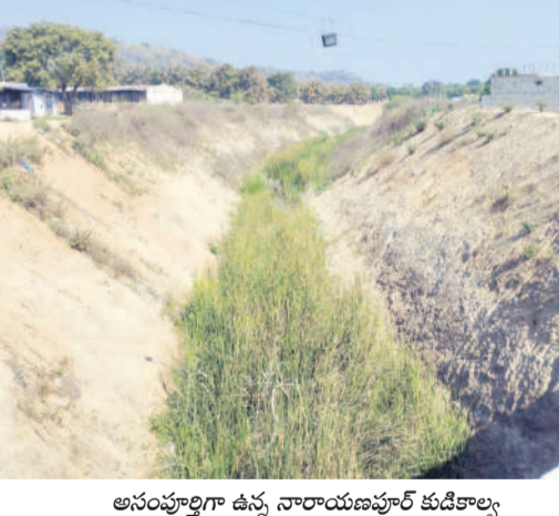
అసంపూర్ణగా ఉన్న నారాయణపూర్ కుడికాల్వ