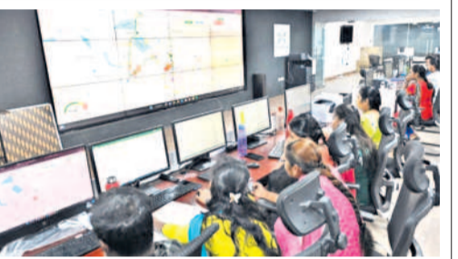
దేలా విశ్లేషణలో సాయపడుతుంది. పోలీస్, ట్రాఫిక్ పోలీస్, హెల్త్, వాల్స్, సాటిల్ వేస్ట్ మేనేజ్మెంట్, ఇరిగేషన్ డిపార్ట్ మెంట్ మొదలైనవి దీనిలో ఏకీకృతమయ్యాయి.

ఇండియన్ ఇన్స్టిట్యూట్ ఆఫ్ మేనేజ్మెంట్ ఇటీవల అధ్యయనం ప్రకారం ఇంటిగ్రేటెడ్ కమాండ్ అండ్ కంట్రోల్ సెంటర్ 93 స్కాల్డ్ సీటీలో మహిళలకు సురక్షితమైన పరిస్థితులను ఏర్పాటు చేసింది. ఇసీసీసీ (ఇంటిగ్రేటెడ్ కమాండ్ అండ్ కంట్రోల్ సెంటర్) 100 స్కాల్డ్ సీటీలో అమలు చేసిన నిజ-సమయ పర్యవేక్షణ వ్యవస్థ ఇది సగం కార్యకలాపాలకు మెరుకు, నాడీ వ్యవస్థగా పని చేస్తుంది. దీన్ని గృహ నిర్మాణ, పట్టణ వ్యవహారాల మంత్రిత్వ శాఖ 2015లో ప్రారంభించింది. సమాచార సమైక్యత, సహకార పర్యవేక్షణను ప్రారంభించడం దీని లక్ష్యం. తద్వారా త్వరిత గతినే నిర్ణయం తీసుకోవడంలో