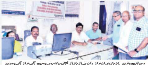
అల్వాల్ సర్కిల్ కార్యాలయంలో సమస్యలను పరిష్కరించే అధికారులు