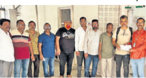
సీఎంకె ఉత్తరాలను పోస్ట్ చేస్తున్న పూర్వ విద్యార్థులు