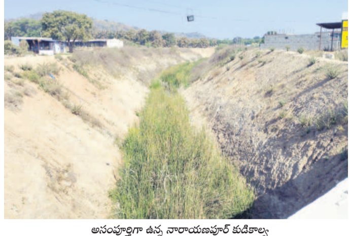
అసంపూర్ణంగా ఉన్న నారాయణపూర్ కుడికాల్వ

నారాయణపూర్ కుడికాల్వ నిర్మాణం కొనసాగడం లేదు. ఎన్నికల ముందు కాంగ్రెస్ అభ్యర్థి హామీ ఇచ్చినా ముందుకెళ్లేలేదు. 19 కిలోమీటర్ల మేర కాలువ పనులను నాటి కాంగ్రెస్ ప్రభుత్వం ప్రారంభించి వదిలేయగా, బీఆర్ఎస్ ప్రభుత్వం వచ్చిన తర్వాత 17 కిలోమీటర్ల పూర్తి చేసింది. ఆ తర్వాత అసెంబ్లీ ఎన్నికల రాగా, మిగిలిన మరో రెండు కిలోమీటర్ల పనులు తాను గెలిస్తే పూర్తి చేస్తానని అప్పుడు మేడిపల్లి నత్తం హామీ ఇచ్చినా అచరణకు నోచలేదు. కొత్త ప్రభుత్వం ఏర్పడి ఏడాదిన్నర కావచ్చునని పనులు మాత్రం ముందుకు కదలడం లేదు. ఫలితంగా పరివాహక ప్రాంతంలో నీరందక పంటలు ఎండుతుండగా, సర్కారు తీరుపై రైతుల్లో ఆగ్రహం వ్యక్తమవుతున్నది.