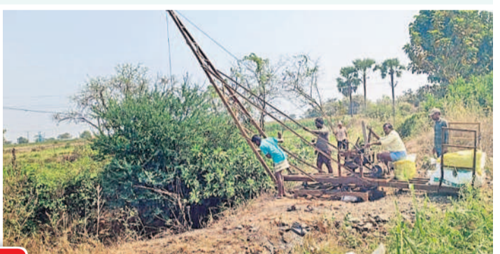
దుభాతండాలో క్రైన్ తో బావిలో పూడిక తీస్తున్న రైతులు