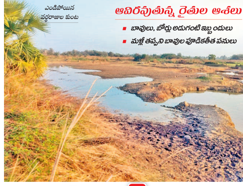
ఎండిపోయిన వర్షారణుల కుంట