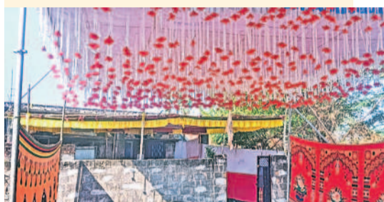
పెండ్లి ఏర్పాటులో ఉన్న ఇళ్ళ

కరీమాబాద్/ నూనంగల్, ఫిబ్రవరి 22 : బంధువుల సందడితో కోలాహలంగా ఉండాలన్న ఆ ఇంట్లో.. విషాదంతో బోసిపోయింది. తెల్లవారే తమ కూతురు పెండ్లి అని సంబురపడిన తల్లిదండ్రులను కొడుకు మరణం వార్త కంగడి సింది. చెల్లి పెళ్ళిలో అన్న తానై