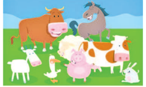
ఒకేలా కనిపిస్తున్న ఈ రెండు చిత్రాల్లో 7 తేదాలున్నాయి. అవేంటో కనిపెట్టండి.