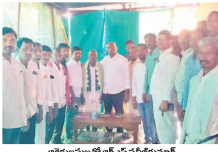
అరికలపల్లెలో ఆర్ఎస్ ప్రవీణ్ కుమార్

దహాం, ఫిబ్రవరి 23 : గల్లిగల్లికి తిరిగి కాంగ్రెస్ సర్కారు వైఫల్యాలను ఎండగడుదామని బీఆర్ఎస్ రాష్ట్ర నాయకుడు ఆర్ఎస్ ప్రవీణ్ కుమార్ పిలుపునిచ్చారు. ఆదివారం మండలం లోని పలు గ్రామాల్లో పర్యటించారు. ఆ పై మండలకేంద్రంలో కార్యక్రమం ముగిసారు. కాంగ్రెస్ ఎన్నికల ముందు అడ్డగోలు హామీలిచ్చిందని, అదికారంలోకి వచ్చాక వాటిని అమలు చేయడంలో పూర్తిగా విఫలమైందన్నారు. ఈ విషయాన్ని పత్రికల ద్వారా తిరిగి ప్రజలకు