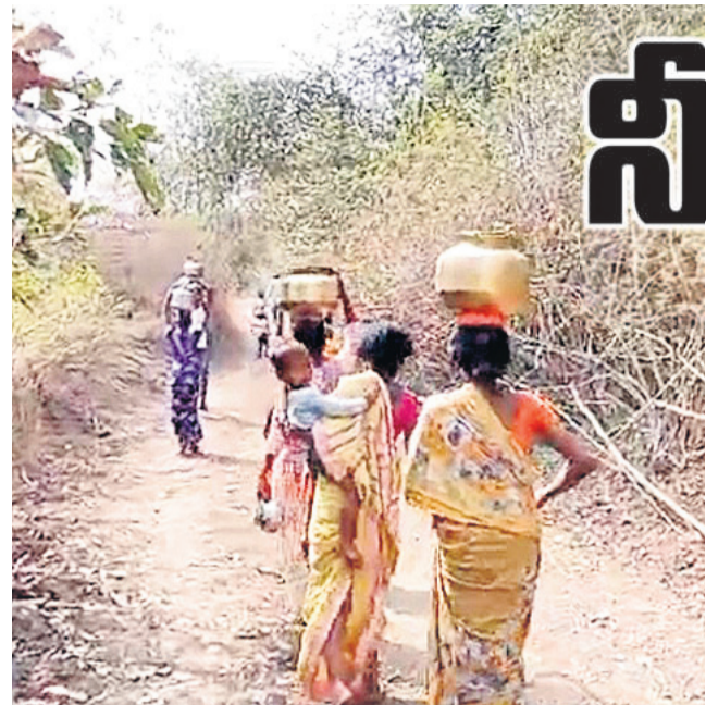
నీటి బండలతో అడవివారం గుండా గ్రామానికి వెళ్తున్న గిరిజనులు