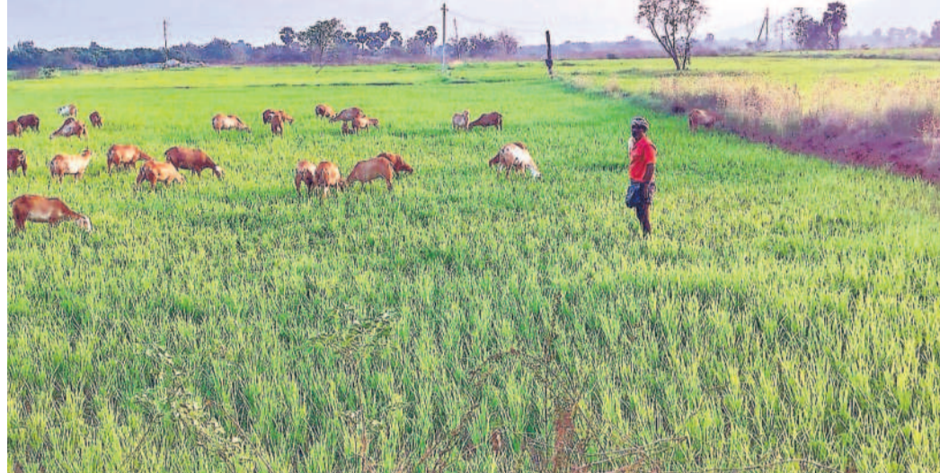
నూతనకల్ మండలం చిల్లకుంట్ల గ్రామంలో వరి పైరును మేస్తున్న గౌరెలు

యాసంగిలో సాగు చేసిన పంటలకు నీటి తడులు అందించలేక అన్నదాతలు ఆందోళనకు గురవుతున్నారు. చేతికి వస్తుందన్న పంట కండ్ల ముందే ఎండిపోతుండడంతో రైతులకు భంగపాటు తప్పడం లేదు. భూగర్భ జలాలు పూర్తిగా అడుగంటగా, బోర్లలో నీళ్లు లేక, ఎస్సారెస్సీ కాల్య ద్వారా సాగు నీరు రాక రైతులు గోస పడుతున్నారు. రైతు భరోసా ఇవ్వక పంట పెట్టుబడులకు వ్యాపారుల దగ్గర అప్పులు తెచ్చినా, పెట్టిన పెట్టుబడులు సైతం రాక దుర్భర పరిస్థితిలో రైతున్నలు ఉన్నారు.