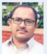
అన్ని ఏర్పాట్లు చేశాం అంటున్న డిప్యూటీ డిప్యూటీ కలెక్టర్ ఆడిశాల మేరకు ఇంటర్ పరీక్షల నిర్వహణకు అంతా సిద్ధం చేశాం. సీఎస్, డిప్యూటీ మేంట్ అధికారులతో ఈ నెల 28న సమావేశం నిర్వహించి సూచనలు చేయనున్నాం. పరీక్షలో ఇబ్బందులు లేకుండా ఫలితంగా సర్వేపై పాటు జిల్లా పరీక్ష విభాగం అధికారులు పర్యవేక్షణ చేస్తారు. విద్యార్థులు కాబయింగ్ పాల్గొంటే ఆ పరీక్ష కేంద్రం చివ్ సూచన రింపెండ్ అవుతుంది. అందుకే బాధ్యులకు కఠిన చర్యలు తీసుకుంటాం. విద్యార్థులు గంట ముందుగానే పరీక్ష కేంద్రాలకు చేరుకోవాలి. ఎండల దృష్ట్యా అన్ని పరీక్ష కేంద్రాల వద్ద ఓఆర్ఎస్ ప్యాకెట్స్ అందుబాటులో ఉంచుతున్నాం.