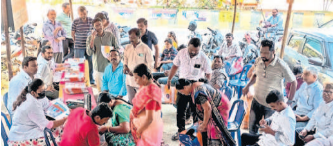
ఉచిత కాలేజీ వైద్య శిబిరంలో పరీక్షలు చేయించుకుంటున్న రోగులు

నేరేడుచర్ల, ఫిబ్రవరి 23 : మండలంలోని దిల్లిపల్లి ప్రభుత్వ పాఠశాలకు పట్టణంలోని జేసీఎంబిఎస్ పెయింటింగ్, రామకృష్ణ వరన్ సింకెట్ అధ్యక్షులతో ఆదివారం రంగులు పెయింట్లు పంపిణీ చేయడం అభినందనీయమన్నారు. అదే విధంగా మరొక మంది దాతలు ముందుకొచ్చి ప్రభుత్వ పాఠశాలలో పాఠశాల కలనకు కృషి చేయాలని కోరారు.