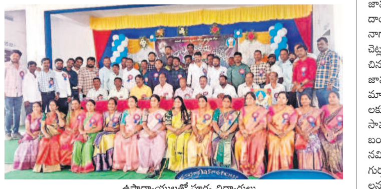
ఉపాధ్యాయులతో పూర్వ విద్యార్థులు