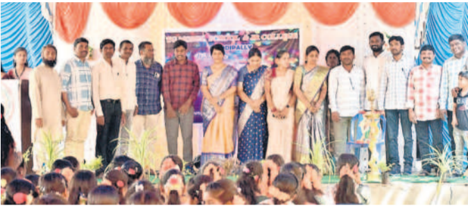
వేడుకల్లో ఉపాధ్యాయులు, విద్యార్థులు