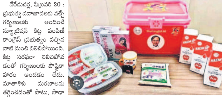
బీఆర్ఎస్ ప్రభుత్వ పాలనలో గర్భిణులకు అందించిన న్యూట్రీషన్ కట్

నేరేడుచర్ల, ఫిబ్రవరి 20 : ప్రభుత్వ దవాఖానలకు వచ్చే గర్భిణులకు అందించే న్యూట్రీషన్ కట్ల పంపిణీ కాంగ్రెస్ ప్రభుత్వం వచ్చిన నాటి నుంచి నిలిచిపోయింది. కిట్ల సరఫరా నిలిచిపోవడంతో గర్భిణులకు పోషకాహారం అందడం లేదు. మాతాశిశు మరణాలను తగ్గించడంతో పాటు, సాధారణ ప్రసవాల పెంచాలని బీఆర్ఎస్ ప్రభుత్వం గర్భిణులకు న్యూట్రీషన్ కట్లను పంపిణీ చేసింది. ప్రభుత్వం ముందస్తులో నుంచి న్యూట్రీషన్ కట్ల కట్ అయ్యింది. మిగిలి ఉన్న కొన్ని కిట్లను రెండు నెలల పాటు కొన్నిచోట్ల పంపిణీ చేశారు. ఆ తర్వాత వాటి ఉపసేదించడం పోయింది. పోషకాహార కిట్ల కోసం గర్భిణులు దవాఖానలో వైద్యులను అడుగుతుంటే తమకు సమాచారం లేదని చెప్పన్నారు.