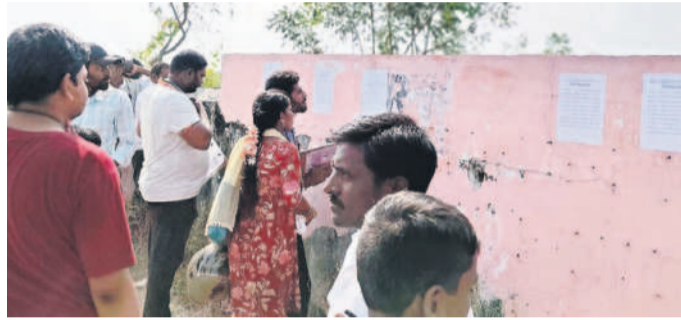
తుంగభద్రలో హాల్టికెట్ సలబద్ధను మానుకుంటున్న విద్యార్థులు

సంఘానికి రాష్ట్ర ప్రభుత్వ గుర్తింపు ఇవ్వాలని మంత్రి దృష్టికి తీసుకువెళ్లారు. అదేవిధంగా మార్గంలో రాష్ట్రస్థాయిలో నిర్వహించే పింఛన్ దారుల క్రిడా సాంస్కృతిక ఉత్సవాలకు రావాల్సిందిగా కోరారు. మంత్రి తుమ్మలకు వినపిత్రం అందించారు. ఓ కార్యక్రమంలో పాల్గొనేందుకు ఆది వారం మంత్రి కోడలకు రాగా ఆయన కలిసి సమస్యలను విన్నవించారు. పెండింగ్లో ఉన్న డీఏ, పీఆర్డీ, ఆరోగ్య భద్రత పథకం అమలు చేయాలని, విశ్రాంత ఉద్యోగుల