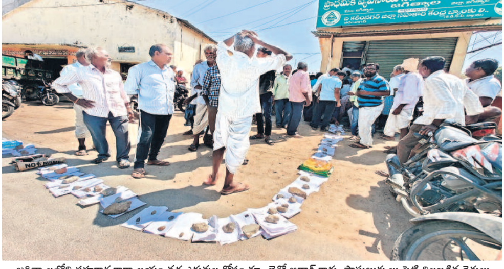
జగిత్యాలలోని సహకార కార్యాలయం వద్ద ఎరువుల కోసం క్యూ లైన్లో ఆధార కార్డు, పాసుబుక్కులు పెట్టి నిలబడిన రైతులు