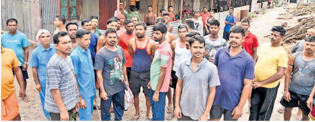
ఎస్ఎల్బీసీ టెన్సెల్ ప్రమాద ఘటనలో తమ సహచరుల ఆహారీ తెలియక ఆందోళనలో ఉన్న కార్మికులు

PUBLISHED FROM KARIMNAGAR • HYDERABAD • WARANGAL • KHAMMAM • NALGONDA • MAHABUBNAGAR • NIZAMABAD www.ntnews.com | /ntdailyonline