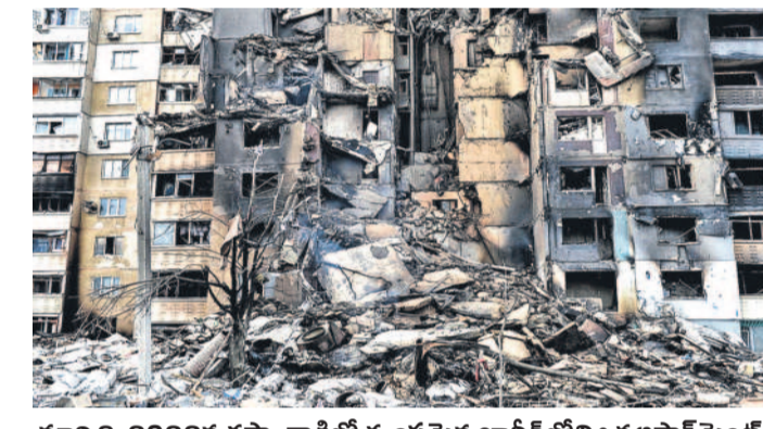
మార్చి 8, 2022న రష్యా దాడిలో ధ్వంసమైన ఖాల్కివోని ఒక లాపాల్ మెంట్

కిక్కిగా ప్రాణాలు కోల్పోయారు. లక్షల మంది నిరాశ్రయలయ్యారు. భారీగా ఆస్తి నష్టం సంభవించింది. ఈ యుద్ధం ఉక్రెయిన్ ఆర్థిక