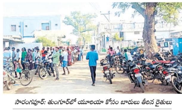
సారంగపూర్: తుంగూర్లో యూలయా కోసం బారులు తీరిన రైతులు