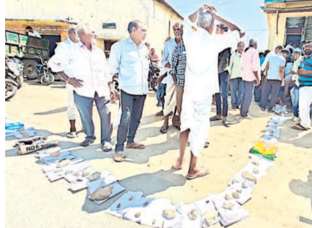
జగిత్యాల రూరల్: క్యూలో ఆధారీ కార్డు, పాస్ బుక్ లు పెట్టి నిల్చున్న రైతులు

జగిత్యాల రూరల్/ సారంగపూర్/ మల్లాపూర్, ఫిబ్రవరి 24 : యూలయా కోసం రైతులు అవ్వల పడుతున్నారు. సహకార సంఘాల గోదామూల వద్ద పార్కులో పడిగాపులు కాస్తున్నారు. ఒక్కొక్కరికి ఒకటి లేదా రెండు మాత్రమే ఇస్తుండడంతో ఎక్కువ అవసరం ఉన్నవారు రోజుల తరబడి తిరుగుతున్నారు. ఒక్కో రోజు అధికంగా దొరకక పోవడంతో నిరాశతో వెనుదిరుగుతున్నారు. జగిత్యాల జిల్లా కేంద్రంలోని సింగిల్ విండో కార్యాలయం వద్ద రైతులు ఆధారీ కార్డు, పాస్ బుక్ లు పెట్టి ఉదయం 8 గంటల నుంచి పడిగాపులు కావడం మార్పు కోసం ఓటు ఆంట్ గా గ్రామీణ ప్రభుత్వం రైతుల నోట్ల మట్టి కొట్టించిన రైతులు ఆవేదన వ్యక్తం చేశారు. బ్లాక్ లో బస్సుకు ₹50