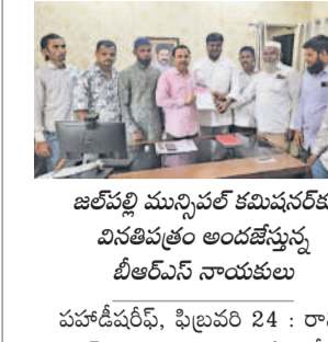
జిల్లాల మున్సిపాలిటీ కమిషనర్లకు వినతిపత్రం అందజేస్తున్న బీఆర్ఎస్ నాయకులు