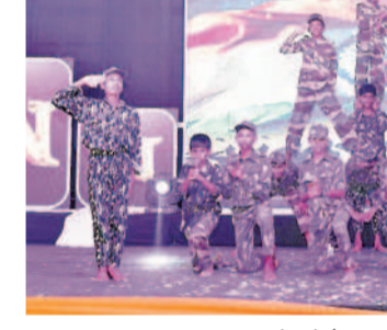
అక్షయ్ కుమార్ విద్యార్థుల సైనిక ప్రదర్శన