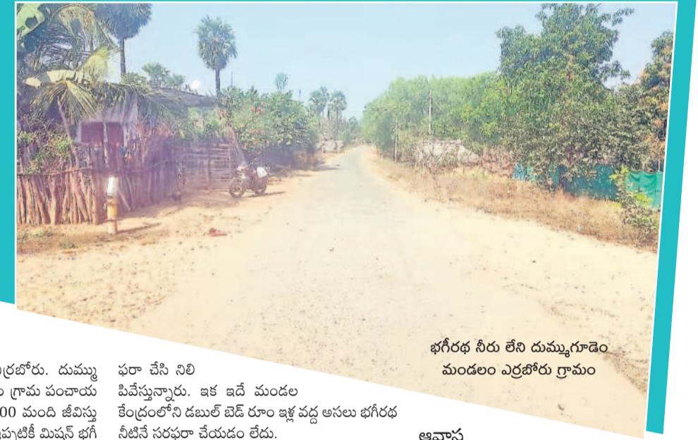
భగీరథ నీరు లేని దుమ్ముగూడెం మండలం ఎర్రబోరు గ్రామం

అది మారుమూల గ్రామం ఎర్రబోరు. దుమ్ము గూడెం మండలం పెదకమలాపురం గ్రామ పంచాయతీలోని ఈ చిన్న పల్లె. అక్కడ 400 మంది జీవిస్తున్నారు. అందరూ కూలిలే. వారికి ఇప్పటికీ మిషన్ భగీరథ నీటిని సరఫరా చేయడం లేదు. వేటిపంపులే వారికి దిక్కుగా ఉన్నాయి. గత ప్రభుత్వం వేసిన మిషన్ భగీరథ నల్లాలకు కనీసం కనెక్షన్లు కూడా ఇవ్వడం లేదు. ఆ నల్లాలు మట్టిలో కలిసిపోతున్నా కూడా కనెక్షన్లు చూడడం లేదు. ఇప్పటికే వేసిన సమీపించింది. ఎండలు మరికొంత ముదిరితే గ్రామస్థులు తాగునీటి కోసం అల్లాడిపోతారు. కానీ.. కాంగ్రెస్ ప్రభుత్వం మాత్రం కనీసం మాత్రంగా కూడా కనీసం చూడడం లేదు. అయితే, ఇలాంటి గ్రామాలు జిల్లాలో ఇంకా అనేకం ఉండడం గమనార్హం. కాగా.. పెదకమలాపురం గ్రామంలో భగీరథ నీటిని సరఫరా చేస్తున్నట్లు అన్ని కుటుంబాలకు సరిపోవడం లేదు. కొద్దిమొత్తంగా సర