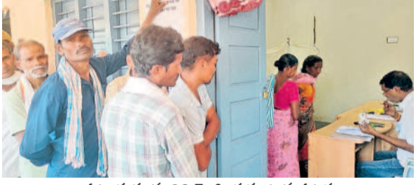
ఓటూ హక్కును వినియోగించుకుంటున్న ఓటర్లు