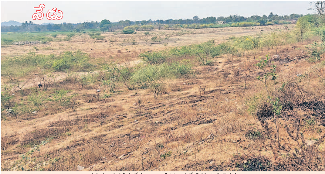
ప్రస్తుతం చుక్కనూరు లేకుండా ఎండిపోయిన మేడిపల్లి సాటి చెరువు