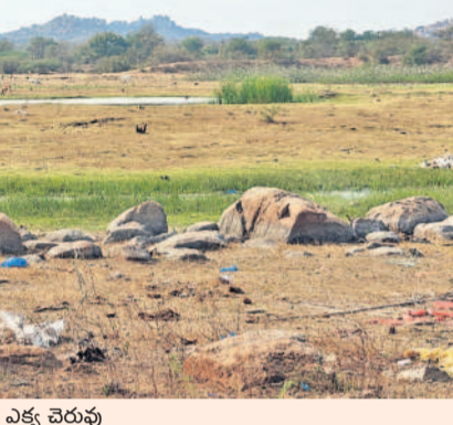
ఉడుగుంటిన ఎక్క చెరువు