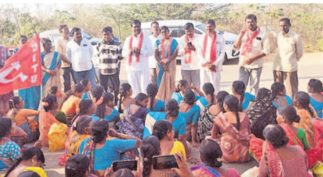
రంగారెడ్డి జిల్లా కలెక్టర్ కార్యాలయం ఎదుట ధర్నా చేస్తున్న మధ్యాహ్న భోజన కార్మికులు

ఆదిల్పట్ల, ఫిబ్రవరి 24 : మధ్యాహ్న భోజన కార్మికుల సమస్యలను వెంటనే పరిష్కరించాలని సీపీఎం జిల్లా కార్యదర్శి పగ డాల యాదయ్య అన్నారు. సోమవారం రంగారెడ్డి జిల్లా కలెక్టర్ కార్యాలయం ఎదుట మధ్యాహ్న భోజన కార్మికులతో సీబీఎం జిల్లా అధ్యక్షులతో పెద్దఎత్తున ధర్నా నిర్వహించారు.