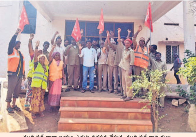
మున్సిపల్ కార్యాలయం ఎదుట నిరసన చేస్తున్న మున్సిపల్ కార్మికులు