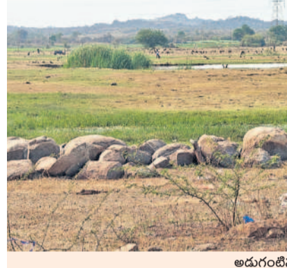
అడుగుంటిన ఎక్క చెరువు

మండలంలో రోజురోజుకూ కరువు ఛాయలు కమ్మకుంటున్నాయి. కేసీఆర్ హయాంలో గత పదేండ్లు చెరువులు, కుంటలు నిండి మత్తడి దుంకి రైతుల కండ్లలో ఆనందం నిండింది. కానీ, ప్రస్తుతం సీసీ ఒక్క సాలిగా లిఫ్ట్ అయ్యింది. కాంగ్రెస్ ప్రభుత్వం వస్తూనే కరువును తీసుకొచ్చింది. నాడు నీటితో కళకళలాడిన చెరువులు, కుంటలు రోజురోజుకూ అడుగుంటున్నాయి. బోరుబావులు అప్పుడే ఆరిపోయాయి. వేసవిలో వ్యవసాయానికి, సాగునీటికి ప్రమాద ఘంటికలు మోగి పరిస్థితులు నెలకొన్నాయి. - యాచారం, ఫిబ్రవరి 24