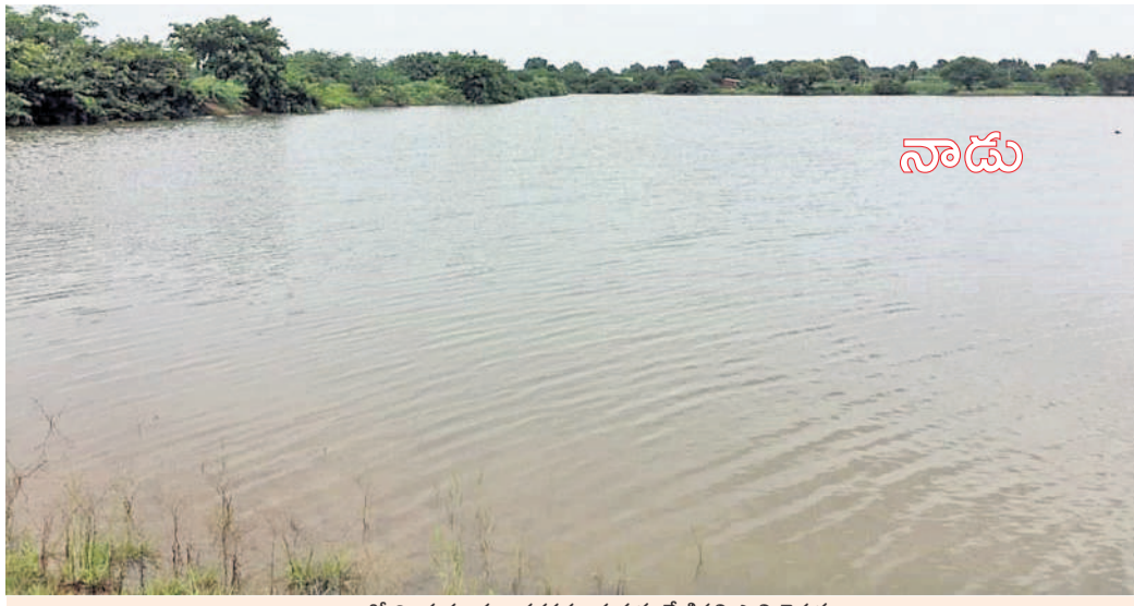
2023లో నిండుకుండా కళకళలాడుతున్న మేడిపల్లి సాటి చెరువు

మాకొద్దు 16 మంది విద్యార్థులను అవేదన వికారాబాద్, ఫిబ్రవరి 24 : విద్యార్థులకు విద్యాలయం నేరూర్ లో ఉపాధ్యాయుడి విద్యార్థులను అవేదన చేశారు. ప్రధానోపాధ్యాయుడు గత కొన్ని రోజులుగా అసభ్యంగా ప్రవర్తనలు చేస్తున్నాడు. పాఠశాలలో 4వ తరగతిలో 10 మంది, 5వ తరగతిలో 6గురు విద్యార్థులను అవేదన చేశారు. కడుపు గొల్లడ, అసభ్యంగా తాకుతూ ఉన్న విద్యార్థులను తల్లిదండ్రులు తెలిపారు. మూడు రోజుల క్రితం విద్యార్థులను తల్లిదండ్రులు పాఠశాలకు వచ్చి ఆ ఉపాధ్యాయుడిపై మండిపడ్డారు. 16 మంది విద్యార్థులను ఈ సారీ మాకొద్దు అంటూ ప్రధానోపాధ్యాయుడికి ఫిర్యాదు చేశారు. ప్రధానోపాధ్యాయుడు ఆయనను పిలిచి మరోసారి ఇలాంటివి చేయకూడదని మందలించారు. ఈ విషయం వికారాబాద్ మండల విద్యాధికారి దృష్టికి తీసుకెళ్లినట్లు సమాచారం. విద్యార్థులు, వారి తల్లిదండ్రులు ఆ సారీను ధ్యాచారం పాఠశాల నుంచి బదిలీ చేయాలని డిమాండ్ చేశారు.