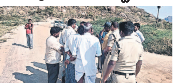
ఇలగిపేట్ అధికారులు, పోలీసులకు గోరూ వెల్లబోసుకుంటున్న లక్ష్యాపూర్ణ భూనిర్మాణాలు

మంగ్రూడ(నాంపల్లి), ఫిబ్రవరి 24 : భూములను కోల్పోయిన నిర్వాసితులుగా మారిన తమకు ఉపాధి అవకాశాలు ఉన్న చోట పునరావాసం కల్పించాలని లక్ష్యాపూర్ణ ప్రాజెక్టు ముంపు బాధితుల డిమాండ్ చేశారు. రంగారెడ్డి జిల్లా ఇల్లాపాంపట్నంలో ప్లాట్లను కేటాయింబి కొరారు. ఈ మేరకు రెండో రోజు సోమవారం లక్ష్యాపూర్ణ ప్రాజెక్టు పనులను అడ్డగిస్తారు.