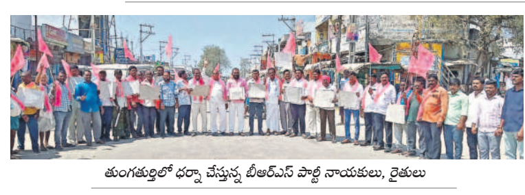
తుంగతుర్తిలో ధర్మా చేస్తున్న బీఆర్ఎస్ పార్టీ నాయకులు, రైతులు

కల నియమావళి 1961 ప్రకారం బాధ్యులపై చర్యలు తీసుకుంటామని నల్లగొండ కలెక్టర్, ఎన్నికల రిటర్నింగ్ అధికారి ఇలా త్రిపాటి హెచ్చరించారు. ఈ 48 గంటల సమయంలో ఇతర జిల్లాలకు చెందిన వారు జిల్లాలో ఉండవద్దని సూచించారు. ఈ సమయంలో మద్యం ఎక్కడ అమ్మకాలు చేయబడతాయి అనేది నిషేధం విధించారు. వచ్చే నెల మూడున కూడా అమ్మకాలు చేయడం లేదా సర్వీ చేయడంపై నిషేధం విధించారు. నిబంధనలు ఉల్లంఘిస్తే ప్రజాప్రాతినిధ్యం పట్టి 1951, ఎన్ని