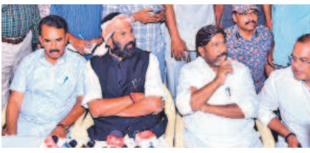
సారంగం వద్ద మీడియాతో డిప్యూటీ సీఎం భట్టిబిక్రమార్య, మంత్రులు ఉత్తమకుమార్ రెడ్డి, జూపల్లె కృష్ణారావు, కోమటిరెడ్డి వెంకటరెడ్డి