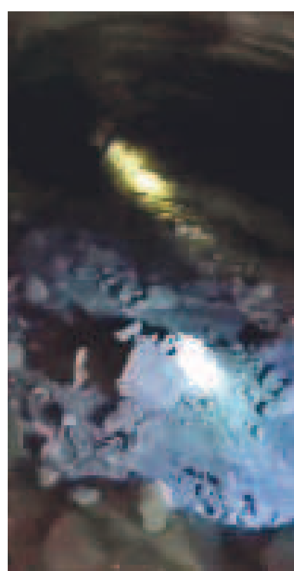
సారంగం పైభాగం నుంచి కుప్పకూలిం రాష్ట్ర, మట్టిబట్టలు

సహా, అనేక అంశాలపై న్యాయ కమిషన్ ఏర్పాటు కోసం డిమాండ్ చేశారు గుర్తు చేశారు. రాష్ట్రంలో అధికారంలోకి వచ్చిన తర్వాత కూడా అనేక న్యాయ కమిషన్లు ఏర్పాటు చేశారని చెప్పారు. 'తాజా ప్రమాదాలపై న్యాయ విచారణ కమిషన్ ను వెంటనే ఏర్పాటు చేయాలని