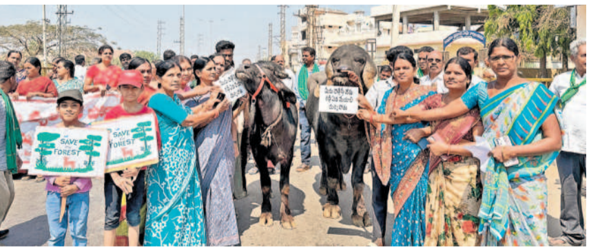
సంగారెడ్డి జిల్లా గుమ్మడిదలలో జాతీయ రహదారిపై దున్నపోతులతో రైతుల నిర్వహిస్తున్న రైతు జేపీసీ నాయకులు, మహిళలు

దృష్టి పెట్టాలని సీఆర్ఎస్ బలగాలు కేఆర్ఎంబీ (కృష్ణారెవర్ మేనేజిమెంట్ బోర్డు) సూచించింది. మంగళవారం తెలు రాసింది. బోధ్య ఆదేశాల మేరకే కాలువల నుంచి నీటిని విడుదలను పరిమితం చేయాలని పేర్కొంది.