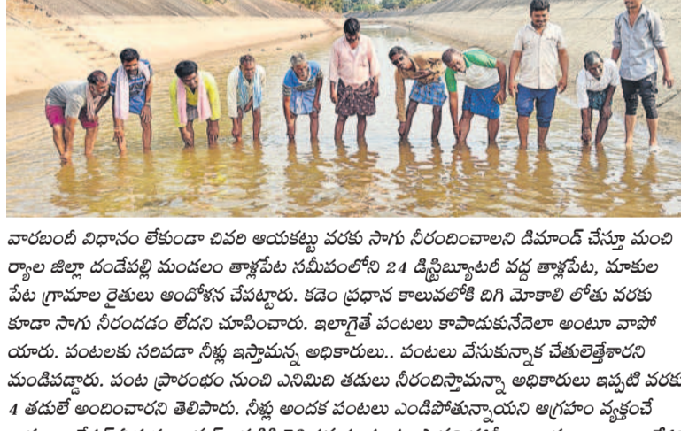
వారంబటి విధానం లేకుండా చివరి ఆయకట్టు వరకు సాగు నీరుందించాలని డిమాండ్ చేస్తూ మంచి రైతుల జిల్లా దండేపల్లి మండలం తాళ్లపేట సమీపంలోని 24 డిప్యూటీలు వద్ద తాళ్లపేట, మాచిలపేట గ్రామాల రైతులు ఆందోళన చేపట్టారు. కడెం ప్రధాన కాలనల్ కి దిగి మోకాలి లోతు వరకు కూడా సాగు నీరుందడం లేదని చూపించారు. ఇలాగేనే పంటలు కాపాడుకునేవెలా అంటూ వాపోయారు. పంటలకు సరిపడా నీళ్లు ఇస్తామన్న అధికారులు.. పంటలు వేసుకున్నాక వేతులైతేకాదని మండిపడ్డారు. పంట ప్రారంభం నుంచి ఎనిమిది తడులు నీరుందిస్తామన్నా అధికారులు ఇప్పటి వరకు 4 తడులే అందించారని తెలిపారు. నీళ్లు అందక పంటలు ఎండిపోతున్నాయని ఆగ్రహం వ్యక్తం చేశారు. ఇలిగిషన్ ఏకతా క్రావ్ అక్కడికి వెళ్లి సమస్య పరిష్కారాని హామీ ఇచ్చారు. - దండేపల్లి