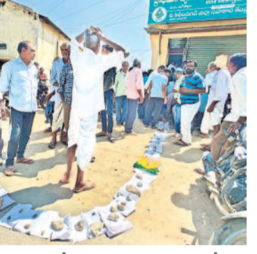
2022-23లో అది 40 లక్షల టన్నులకు చేరింది. ఎనిమిదేండ్లలో 15 లక్షల టన్నుల వినియోగం పెరిగింది. అయినప్పటికీ, ఎక్కడా కొరత రాకుండా బీఆలస్యం పంపించి అక్కడ నిల్వ చేసేవారు. దీంతో రైతులకు ఎక్కడ అవసరమైతే అక్కడికి వెంటనే సరఫరా చేసి కొరత లేకుండా చూసేవారు. దీంతోపాటు ఎన్ని ఎకరాలు సాగువుతాయో కచ్చితంగా అంచనా వేసి అందుకు కాస్త అదనంగానే తీసుకొచ్చేవారు. దీంతో కొరత అనే మాటే వివక్షలేదే.

కారులతో రోజుల తరబడి సమీక్షలు నిర్వహించారు. తద్వారా ఎరువుల గోస తీర్చిందిక 'ముందస్తు' పూహాన్ని అమలుచేయాలని నిర్ణయించారు. ఉమ్మడి రాష్ట్రంలో సీజన్ ప్రారంభమయ్యాక, రైతులు పంటలు వేయడం మొదలుపెట్టిన తర్వాత కేంద్రం నుంచి ఎరువులు తీసుకొచ్చేవారు. కేసీఆర్ అందుకు భిన్నంగా సీజన్ ప్రారంభానికి ముందే కేంద్రం నుంచి ఎరువులు తీసుకొనిరావాలని ఆదికారులను ఆదేశించారు. సకాలంలో ఎరువులు రప్పించేందుకు పలువురు అధికారులను ప్రత్యేకంగా డిటికీ పంపించేవారు. వారంతా రెండు మూడు రోజులు డిటికీ ముఖం వేసి అక్కడి అధికారులతో మాట్లాడి రాష్ట్రానికి అవసరమైన ఎరువులు తీసుకొచ్చేవారు. దీంతో యాసంగి సీజన్ కు అక్టోబర్, నవంబర్ లోనే కావాల్సిన ఎరువులను తీసుకొచ్చి, వెంటనే మండల స్థాయికి పంపించి అక్కడ నిల్వ చేసేవారు. దీంతో రైతులకు ఎక్కడ అవసరమైతే అక్కడికి వెంటనే సరఫరా చేసి కొరత లేకుండా చూసేవారు. దీంతోపాటు ఎన్ని ఎకరాలు సాగువుతాయో కచ్చితంగా అంచనా వేసి అందుకు కాస్త అదనంగానే తీసుకొచ్చేవారు. దీంతో కొరత అనే మాటే వివక్షలేదే.