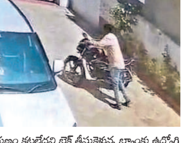
రుణం కట్టలేదని బైక్ తీసుకోవడాన్ని బ్యాంకు ఉద్యోగి