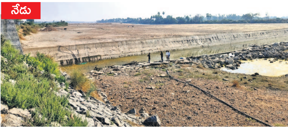
జయశంకర్ భూపాలపల్లి జిల్లా టోకుమట్ల మండలంలోని చలివారు చెక్ డ్యామ్ ఇప్పుడు పూర్తిగా వట్టిపోయింది. ప్రస్తుతం కాంగ్రెస్ ప్రభుత్వం కాశీఖర్ ప్రాజెక్టును విస్తరించడంతో ఫిబ్రవరిలోనే మానేరు వారు, చలివారు ఎండిపోయాయి. సాగునీళ్లు అందక అన్నదాతలు అలగడం వదులుతున్నారు. నీటిని తీసుకురావడంలో ప్రస్తుత కాంగ్రెస్ ప్రభుత్వం విఫలమైందని రైతులు తీవ్ర అసహనం వ్యక్తం చేస్తున్నారు. ప్రస్తుతం కాంగ్రెస్ పాలనలో డీబీఎం- 38 కెనాల్ మళ్లీ పిచ్చి మొక్కలు పెరిగి, నీరు కిందికి ప్రవహించలేని దుస్థితి నెలకొన్నది. ప్రస్తుతం చలివారు పూర్తిగా ఎండిపోయిందని, నీటి విడుదల చేసినా మైన ఉన్న రైతులే వాడుకుంటున్నారని, టోకుమట్ల మండలానికి నీరు చేరే పరిస్థితి లేదని రైతులు వాపోతున్నారు. - టోకుమట్ల