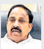
టన్నెల్ లో చిక్కుకున్న వాళ్లను ఎలాగైనా కాపాడు పరమేశ్వరా!

హైదరాబాద్, ఫిబ్రవరి 25 (నమస్తే తెలంగాణ): యూరియా కోసం కొంత మంది కావాలనే రైతులతో క్యూలైన్ లో చెప్పలు, పానీయకూలలు పెట్టిస్తున్నారని వ్యవసాయ శాఖ మంత్రి తుమ్మల నాగేశ్వరరావు వివాదస్పద వ్యాఖ్యలు చేశారు. రాష్ట్రంలో యూరియా కొరత లేదని చెప్పారని. అయితే, ప్రాథమిక సహకార సంఘాల వద్ద పెద్ద సంఖ్యలో రైతులు ఎందుకు గుమ్మరాడుతున్నారో, గంటలపాటు ఎందుకు వేచి చూస్తున్నారో కారణం మాత్రం మంత్రి చెప్పలేదు. మంత్రి తుమ్మల వ్యాఖ్యలపై సర్కారు విమర్శలు వ్యక్తమవుతున్నాయి. మంత్రి చెప్పినట్లుగా ఒకవేళ యూరియా అందుబాటులో ఉంటే.. పంటికి ఎందుకు ఆలస్యమవుతున్నది? అధికారులు విఫలమవుతున్నారా? అనే ప్రశ్నలు ఉత్పన్నమవుతున్నాయి. మళ్లీ యూరియా గోస శీర్షిక సోపానం 'నమస్తే తెలంగాణ' కథనం ప్రచురించిన నేపథ్యంలో మంత్రి తుమ్మల యూరియా పంపిణీపై సమీక్ష నిర్వహించారు. ఈ సందర్భంగా 'నమస్తే తెలంగాణ' కథనాన్ని పరోక్షంగా పేర్కొంటూ.. రైతులతో కావాలనే క్యూలైన్ లో చెప్పలు, పానీయకూలలు పెట్టిస్తున్నారని వ్యాఖ్యానించారు. తద్వారా ప్రభుత్వంపై దుర్మనాచరం చేయడం దేశోపాటు రాజకీయం లబ్ధి పొందాలని చూస్తున్నారని ఆరోపించారు. అసలు రాష్ట్రంలో యూరియా కొరత లేదని ప్రస్తుతం 1.4 లక్షల టన్నుల నిల్వలు ఉన్నాయని తెలిపారు. మరో 80 వేల టన్నుల కోసం కేంద్రానికి ప్రతి పాదనలు పంపిస్తున్నట్లు వెల్లడించారు.