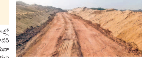
ఇసుక క్యారీలతో వేసిన రోడ్డు

ఏటూరునాగారం, ఫిబ్రవరి 25 : ఎగువ ప్రాంతాల్లో ఏర్పాటు చేసిన ఇసుక క్యారీలతో జంపన్న వాగు, గోదావరి కరకట్టకు వరద ముప్పు పొంది ఉంది. దీంతో ఏటూరునాగారం మండల కేంద్రం ఎప్పుడు మునిగిపోతుందో తెలియని పరిస్థితి. 1986లో వచ్చిన గోదావరి వరదల ఏటూరునాగారం సూర్యాపేట ముంచేయడంతో చుట్టూ రామన్నగూడెం వరకు వరద కరకట్ట నిర్మాణం చేపట్టారు. ఉద్ధృతంగా వచ్చే వరద తాకిడి ఇప్పటికీ పలు చోట్ల కరకట్ట దెబ్బతిన్నది. ఇదిలా ఉండగా ఇసుక మేటల తొలగింపు పేరుతో క్యారీల నిర్మాణం ప్రారంభించారు. ప్రభుత్వం ప్రమాదకరంగా మారిన సాగునీటిని పేర్కొంటున్నారు. గోదావరి కరకట్ట వరదలతో, పటిష్టత కోసం నిధులు మంజూరు కాక అక్కడ వరదలతో పంటలు పోతున్నాయి. కరకట్టకు వరద ముప్పు ఉన్నప్పటికీ ప్రభుత్వం, అధికారులు పట్టించుకోవడం లేదని స్థానికులు వాపోతున్నారు. గోదావరి, వాగు మధ్యలో ఇసుక క్యారీలు ఏర్పాటు చేసి వాటిని తొలగించిన తర్వాత సాగునీటి వినియోగం పోతున్నాయి. ఎంత త్వరగా ఇసుక రావడం, నీళ్లు ఉర్రడతతో రైతులు సాగు చేసేందుకు మిమ్మల్ని చూపుతున్నట్లు తెలుస్తున్నది.