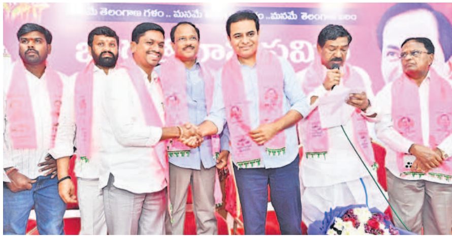
బీఆర్ఎస్ లో చేరిన మాజీ జడ్పీటీసీ వెంకటేశ్వర్లును పార్టీలోకి ఆహ్వానిస్తున్న కేటీఆర్