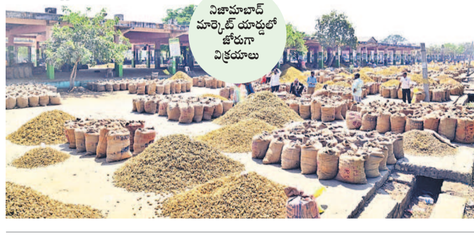
నిజామాబాద్ మార్కెట్ యార్డులో జోరుగా విక్రయాలు