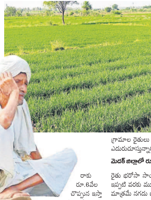
మెడక్, ఫిబ్రవరి 25(సమస్తి తెలంగాణ): బీఆర్ఎస్ ప్రభుత్వం ప్రవేశపెట్టిన రైతు బంధు పథకం కేంద్ర ప్రభుత్వంతో పాటు అనేక రాష్ట్రాలను ఆకర్షించి వారు అమలు చేసినా రైతులు ఇక్కడ జన్మమితి మన్ననలు సైతం పొందింది ఈ పథకం. కేసీఆర్ సీఎం ఉన్నప్పటికీ రోజులుగా ఏటా యాసంగి, వానకాలం రెండు పంటలకు సమయానికి రైతుల ఖాతాల్లో రైతు బంధు జమచేసేవారు. దీంతో రైతులకు పెట్టుబడి కష్టాలు తీరాయి. వడ్డీ వ్యాపారులను ఆర్జయించే బాధలకు తప్పారు. ప్రస్తుతం కాంగ్రెస్ సర్కారు రైతుబంధును రైతుభరోసాగా పేరు మార్చి అమలు చేస్తున్నది. బీఆర్ఎస్ ప్రభుత్వం ఎక్కడో మండలానికి ఒక గ్రామాన్ని ఎంపిక చేసింది. ఏటా రూ.10వేల అందించింది. కాంగ్రెస్ ప్రభుత్వం రైతుభరోసా పథకం కింద ఎక

అందింది. తర్వాత ఎకరా, రెండు, మూడు ఎకరాల్లోపు రైతులకు విడతల వారీగా నగదు జమ చేస్తోంది. కానీ, ఇంకా ఎకరం, రెండు, మూడు ఎకరాల్లోపు ఉన్న కొందరికి నగదు జమ కాకపోవడంతో బ్యాంకుల చుట్టూ రైతులు ప్రదక్షిణ చేస్తున్నారు. ఎందుకు రైతు భరోసా డబ్బులు పడలేదని వ్యవసాయ శాఖ అధికారులు ప్రశ్నిస్తున్నారు. వివిధ కారణాలతో నగదు జమ కాలేదని అధికారులు సమాధానం ఇస్తున్నారు. మూడు ఎకరాలకు పైబడి భూమి ఉన్న రైతులు వేల సంఖ్యలో ఉన్నారు.. నాలుగో విడత ఎప్పుడు వస్తుందో నని రైతు భరోసా కొసం రైతులు ఎదురుచూస్తున్నారు. మెడక్ జిల్లాలో మొత్తం 2,91,399 మంది రైతులు ఉన్నారు. వీరికి రూ. 2,91,85,45,057 డబ్బులు ఖాతాల్లో జమ చేయాల్సి ఉంది. ఇప్పటి వరకు 2,06,472 మంది రైతులకు రూ. 126,35,44,611 ఖాతాల్లో జమ అయ్యింది. ఇంకా 84,927 మంది రైతులకు రూ. 105 కోట్ల రైతు భరోసా జమ కావాల్సి ఉంది. ఇప్పటి వరకు మూడు ఎకరాల వరకు ఉన్న రైతులకు రైతు భరోసా అందించామని ప్రభుత్వం చెబుతున్నది, అది క్లెయిర్మం అందరూ రైతులకు అందలేదని తెలిసింది. ఈ లెక్కన పది ఎకరాల ఉన్న రైతులకు సాగు సాయం అందాలంటే మరో రెండు నెలల సమయం పడే అవకాశం ఉంది.