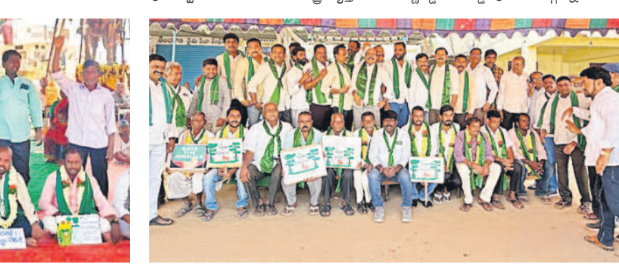
గుమ్మడిదలలో లైట్ నిరాహార దీక్ష చేపట్టిన ఏకవ్యక్తుల సంఘం సభ్యులు, రైతు జేపీసీ నాయకులు