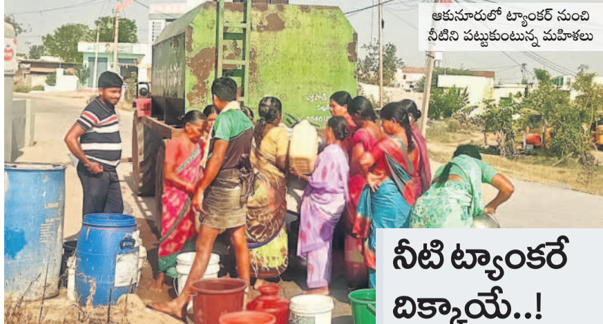
ఆకునూరులో ట్యాంకర్ నుంచి నీటిని పట్టుకుంటున్న మహిళలు