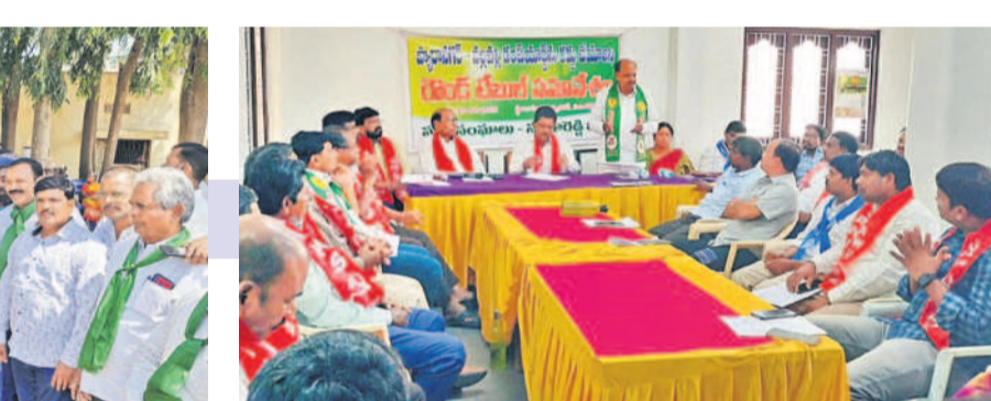
సంగారెడ్డిలో సీపీఎం అధ్యక్షులతో నిర్వహించిన సమావేశంలో పాల్గొన్న ఆ పార్టీ నాయకులు, జేపీసీ నాయకులు