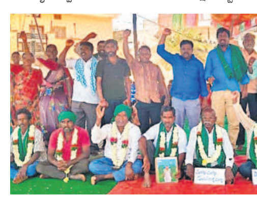
గుమ్మడిదల మండలం నల్లపల్లిలో 21వ రోజు లైట్ నిరాహార దీక్ష చేపట్టిన రజక సంఘం సభ్యులు