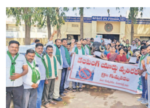
గుమ్మడిదలలో తహసీల్ కార్యాలయం వద్ద దుస్తుపోతులకు వినతి పత్రం అందజేస్తున్న రైతు, మహిళా జేపీసీ నాయకులు

రూ. 6వేల చొప్పున ఇస్తామని చెప్పి అమలు చేస్తున్నది. గతనెల 27న ప్రజాసేవ కార్యక్రమాన్ని నిర్వహించి రూ. 5వేల చొప్పున రెండు పంటలకు కలిపి ఏటా రూ.10వేల అందించింది. కాంగ్రెస్ ప్రభుత్వం రైతుభరోసా పథకం కింద ఎక