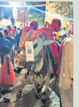
గంగిరెడ్డుకు తగిలించి ఉన్న క్యూఆర్ కోడ్

మేడ్చల్, ఫిబ్రవరి 26: దేశం డిజిటల్ ఇండియాగా మారిపోయింది. ఎవరూ కూడా జేబులో ఫోన్ తప్పక ఉండాలి అంటూ ప్రభుత్వం ప్రోత్సహిస్తోంది. గంగిరెడ్డును తీసుకువచ్చిన వ్యక్తి క్యూఆర్ కోడ్ ను గంగిరెడ్డు ముఖానికి తగలించారు. ఆలయం నుంచి బయటికి వస్తున్న భక్తులకు గంగిరెడ్డుతో దీవెనలు ఇస్తున్నా చీలిలో నగదు లేకపోతే ఆన్లైన్లో డబ్బులు ఇవ్వాలని కోరారు. ఈ దృశ్యాన్ని చూసిన పలువురు ఒకటి అశ్రుధారాని గురవడంతోపాటు డిజిటల్ ఇండియా మహత్వం అని పేర్కొనడం కన్పించింది.