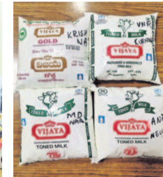
విజయ బ్రాండ్ ను వినియోగించుకుంటూ మార్కెట్లో ఉన్న ఇతర కంపెనీల పాలు