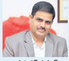
ప్రభుత్వం కుమార్, ఓయూ వీసీ

ఓయూ వీసీకి సీపీ రామన్ ఎక్స్ ప్రెస్స్ అవార్డు