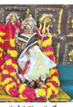
భద్రాచలం శంకర ఆలయంలో కొలువుదీరిన పార్వతి పరమేశ్వరులు