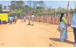
ఇదిలా ఉండగా ఎల్సీనగర్, హయాత్ నగర్, హైటెక్ సిటీ, సుదూర ప్రాంతాల నుంచి వచ్చిన వారు సింగిల్ యూనిట్లు చెప్పగానే కొనుగోలు చేస్తున్నారు. పరిశోధనా కేంద్రం సమీపంలో పండించిన 40 కేరళ పండ్లను ఇతర ప్రదర్శనలో ఉంచారని కొనుగోలుదారులు నమ్మడం దశాబ్ది కలిసిస్తున్నది. దీనిపై సంబంధిత అధికారులు చర్యలు తీసుకోవాలని కోరుతున్నారు.

వ్యవసాయ యూనివర్సిటీ, ఫిబ్రవరి 26: డాక్టర్ కొండా లక్ష్మణ్ ఉద్యమ విశ్వవిద్యాలయం డాక్టర్ ఫెస్టివల్ ముగిసినా.. బుల్లెట్ నుంచి తీసుకువచ్చిన డ్రాక్యుల వద్ద విజ్ఞాన దశాబ్ది విశ్వవిద్యాలయం వాణిజ్యం అయింది. ఈ విషయంపై సంబంధిత అధికారులను వివరణ కోరగా అధికారులు దాట వెళ్తున్నారు. వివరాల కోసం వెళ్తే.. ఈ నెల 17న డాక్టర్ ఫెస్టివల్ మీసేవ రాజరెడ్డి ప్రారంభించగా.. గత అధికారంలో ముగిసింది. అయినా అదే పేరుతో స్టాన్లను కొనసాగిస్తున్నారు. కిలో రూ.400 వరకు విక్రయం చేస్తున్నారు. ఫెస్టివల్ ముగిసినా ఎందుకు విక్రయాలు జరుపుతున్నారని ప్రశ్నించగా పాతన లేని సమాధానం చెబుతున్నారు.