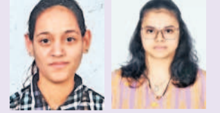
డించారు. వివరాలకు వెబ్సైట్ www.icsi.edu సందర్శించవచ్చని తెలిపారు. కంపనీ సెక్టర్ లోని ప్రాఫెషనల్ ప్రోగ్రామ్, ఎగ్జిక్యూటివ్ ప్రోగ్రామ్ తయారీ పరీక్షలు జూన్ 1 నుంచి 10వ తేదీ వరకు జరుగుతాయని తెలిపారు. పరీక్ష రూసుమును ఫిబ్రవరి 28 నుంచి అప్లై చేస్తూ ద్వారా చెల్లించవచ్చని సూచించారు.