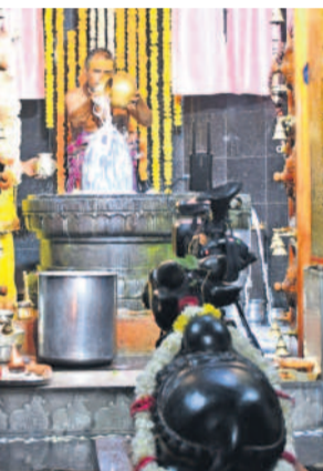
సికింద్రాబాద్ లో గణేశ్ ఆలయంలో శివరాత్రి సందర్భంగా అభిషేకం చేస్తున్న పురోహితుడు