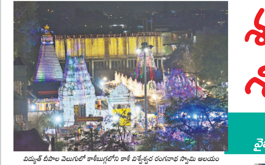
విద్యుత్ దీపాలు వెలుగులో కాణ్ణిగల్లోని కాశీ విశ్వేశ్వర రంగనాథ స్వామి ఆలయం