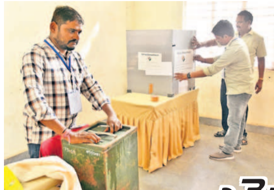
హనుమకొండ కేడీసీలో ఎమ్మెల్యే ఎన్నికల పోలింగ్ కేంద్రం వద్ద ఏర్పాటు చేస్తున్న అధికారులు