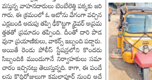
ఎల్లతుర్తి వద్ద ఎడ్లబండ్ల డీకొట్టడంతో డ్రైవర్లను అడ్డంకి