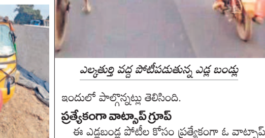
ఎల్లతుర్తి వద్ద పోలీసులను ఎడ్ల బండ్లు

ఇందులో పాల్గొన్నట్లు తెలిసింది. ప్రత్యేకంగా వాల్టాప్ గ్రూప్ ఈ ఎడ్లబండ్ల పోలీస్ స్టేషన్ ప్రత్యేకంగా ఓ వాల్టాప్ గ్రూప్ ను ఏర్పాటు చేసుకున్నట్లు తెలిసింది. ఇందులో సభ్యులను పొందాలనుకునే వారు కొంత నగదు చెల్లింపాల్సి ఉంటుంది. అందులో పోలీసు నిర్వహించే తీరు, సమయం, స్థలం తదితర వివరాలను నిర్వహించుకుంటుంది. పోలీస్ గెలుపొందిన వారికి మొదటి, ద్వితీయ, తృతీయ బహుమతులు నగదు రూపంలో అందజేస్తున్నట్లు తెలిసింది. దీంతో కొందరు యంత్రులు ఈ పోలీస్ స్టేషన్లలోని కొందరు ప్రాంతాల నుంచి ప్రత్యేకంగా ఎడ్లను హజూరాబాద్ మండలం కందుగులకు చెందిన యంత్రులు