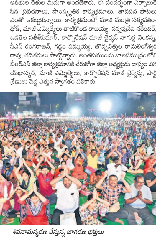
శివనామ స్మరణ చేస్తున్న జాగరణ భక్తులు