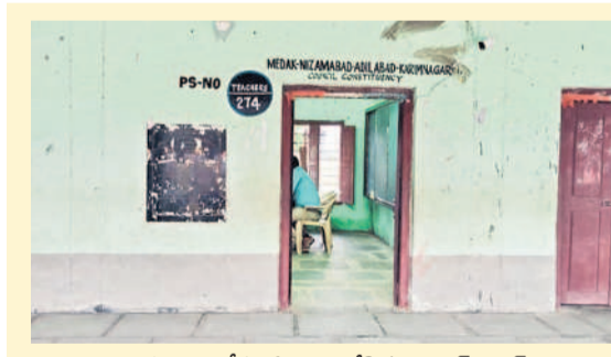
ఒక్క ఓటు కోసం ఏర్పాటు చేసిన పోలింగ్ బూత్

వరంగల్-ఖమ్మం-నల్గొండ ఉపాధ్యక్షులు నియోజకవర్గ ఎన్నికలకు సంబంధించి గురువారం ఎన్నికల ఓటింగ్ ప్రక్రియ జరుగుతుంది. ఉదయం 8 నుంచి సాయంత్రం 4 గంటల వరకు ఓటింగ్ కొనసాగుతుంది. ఉమ్మడి వరంగల్ జిల్లాలో 11,189 మంది ఓటర్లకు గాను 76 పోలింగ్ కేంద్రాలను ఏర్పాటు చేశారు. అన్ని పోలింగ్ కేంద్రాల్లోనూ ఇప్పటికే జిల్లా యంత్రాంగం అధ్యక్షులు ఏర్పాటు చేసి సర్దుబాటు అధికారులు తెలిపారు. అయితే హనుమకొండ జిల్లాలో 8, వరంగల్ జిల్లాలో 6, ములుగు జిల్లాలో 3 సమస్యాత్మక పోలింగ్ కేంద్రాలను గుర్తించారు. ఈ కేంద్రాల వద్ద బండ్లను ఏర్పాటు చేశారు. ఉమ్మడి జిల్లా పరిధిలో జరుగుతున్న ఎన్నికల నేపథ్యంలో ఆయా జిల్లాల కలెక్టర్లు ఇప్పటికే పలుమార్లు అధికారులతో కేంద్రస్థాయి సమావేశాలు నిర్వహించి పోలింగ్ సజావుగా జరిగేలా చర్యలు తీసుకోవాలని ఆదేశించారు.