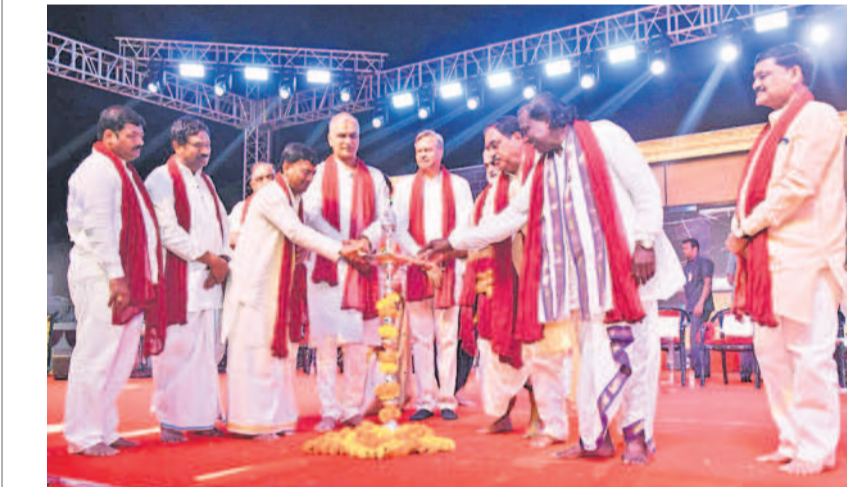
శ్రోతీప్రజ్వలన చేస్తున్న మాజీ మంత్రి హరీశ్ రావు