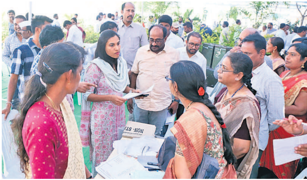
హనుమకొండ కేడీసీలో పోలింగ్ సిబ్బందికి సూచనలు చేస్తున్న కలెక్టర్ ప్రాచీణ్