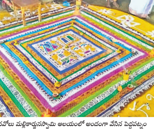
ఐనవోలు మల్లికార్జునస్వామి ఆలయంలో అందంగా వేసిన పెద్దపట్టు

'శివనామశివనామ.. హరహర మహాదేవ.. శంఖో శంకరం' అంటూ శివనామ స్మరణతో ఆలయాలు మార్చిగిగాయి. ఉమ్మడి వరంగల్ జిల్లావ్యాప్తంగా మహాశివరాత్రి వేడుకలు బుధవారం వైభవంగా జరిగాయి. ఉదయం నుంచి శైవ శ్రీతాలలు భక్తులతో కిటికీలాడినాయి. ఉపవాస దీక్ష చేపట్టి ఆలయాలు లకు భారీగా తరిలవబడిన భక్తులు భోజనా శంకరుడి దర్శనం కోసం బారులు తీరారు. వరమేశ్వరుడికి అభిషేకాలు, ప్రత్యేక పూజలు నిర్వహించి తరించారు. హనుమకొండలోని వేయిస్తంభాల గుడి, మడికొండలోని మెట్ట రామలింగేశ్వరస్వామి, ఐనవోలు మల్లికార్జున స్వామి, వరంగల్లోని కాశీ విశ్వేశ్వర, కోటిలింగాల ఆలయాలు, ములుగు జిల్లాలోని రామప్ప, జయశంకర్ భూపాలపల్లిలోని కాశీేశ్వరం, కోటకల్లు, మహబూబాబాద్లోని కురవి వీరభద్రస్వామి, జనగామలోని పాలకర్తి సోమేశ్వరాలయం, కొండపాడు సద్గురుగట్లతోపాటు అన్ని ఆలయాల్లో శివరాత్రి ఉత్సవాలు సాగింజరిగాయి. ఐనవోలులో మల్లికార్జునస్వామికి ప్రత్యేకమైన పెద్దపట్టును ఒక్క పూజారులు నిర్వహించగా భక్తులు పెద్ద సంఖ్యలో పాల్గొన్నారు. కాశీేశ్వరంలో శివపార్వతుల కల్యాణాన్ని అంగరంగ వైభవంగా జరిపించారు. భక్తుల జాగరణ కోసం ఆలయాలు, ప్రత్యేక ప్రాంతాల్లో ఏర్పాటు చేసిన సాంస్కృతిక కార్యక్రమాలు ఆకట్టుకున్నాయి. - నమస్తే నీటివర్షి, ఫిబ్రవరి 26