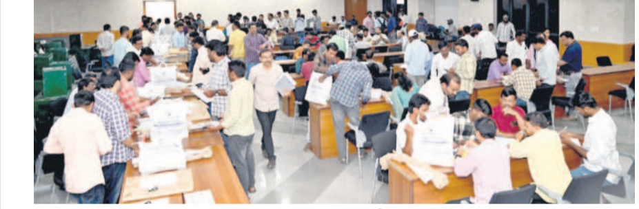
ఆసిఫాబాద్లో ఎన్నికల సామగ్రిని పంపిణీ చేస్తున్న అధికారులు