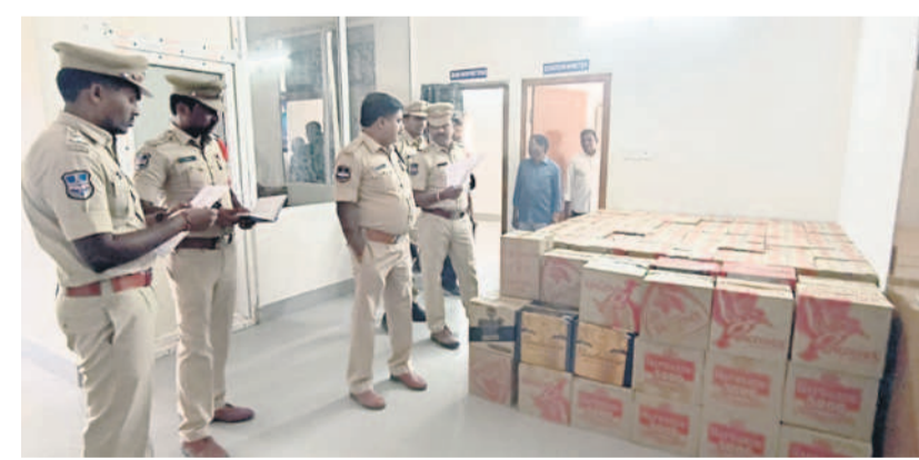
సీజ్ చేసిన మద్యాన్ని పరిశీలించిన డీఎస్సీ, రామానుజం, పోలీసు అధికారులు