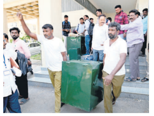
ఆసిఫాబాద్లో ఎన్నికల సామగ్రిని పోలింగ్ కేంద్రాలకు తరలిస్తున్న సిబ్బంది