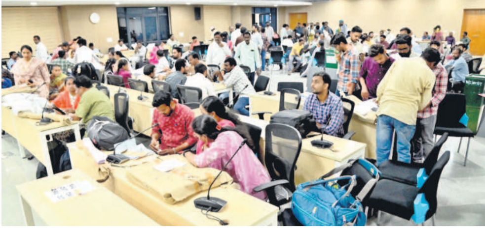
మంచిర్యాల జిల్లా కలెక్టరేట్లో పోలింగ్ సామగ్రిని పంపిణీ చేస్తున్న అధికారులు